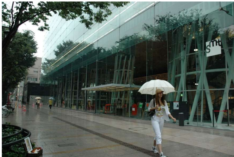
Figure 5 – Intégration du joint parasismique dans le calepinage du sol urbain.

Ce dispositif « sacrificiel », s'il protège considérablement des vibrations la superstructure en cas de séisme, induit de très grands déplacements relatifs entre la base du bâtiment et le sol environnant. Une bande fusible intégrée dans le calepinage du sol urbain (fig. 5) permet donc de les absorber, tout en marquant une subtile limite entre la médiathèque et l'espace public, dans le continuum du sol urbain. Ainsi, ce pur dispositif d'ingénierie, non visible et non accessible au public, n'est pas totalement exclu de l'architecture qu'il sert.