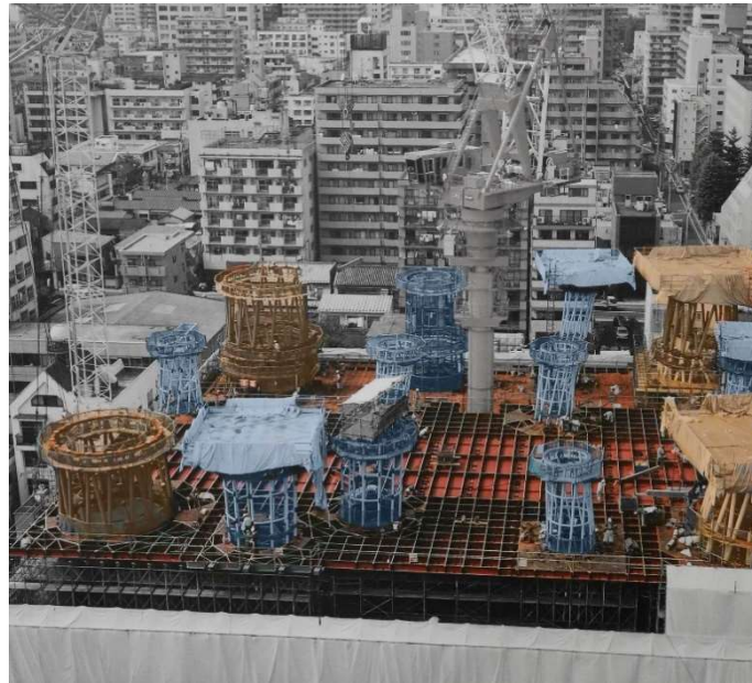
Figure 1 – Colonnes assurant la reprise des charges horizontales en orangé, colonnes n'assurant que la descente des charges gravitaires en bleu. Photomontage d'après photo de chantier tirée de [3].

Les autres colonnes, déchargées de cette fonction très contraignante, ont donc pu être dimensionnées et positionnées plus librement, d'autant que leurs morphologies leur confèrent des capacités portantes naturellement élevées et modulables.