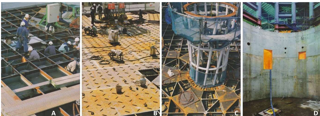
Figure 3 – Partie courante d'un plancher caisson avant pose de la membrure supérieure (A). Tronçons de fers à béton, faisant office de connecteurs « en cisaillement », soudés sur la membrure supérieure d'un plancher caisson (B). Nervures rayonnantes et concentriques à proximité d'une colonne creuse « centrale » (C). Soubassement en béton armé et portiques à traverses ductiles situés à l'aplomb d'une des quatre colonnes d'angle (D).

La seconde est d'avoir opté pour une structure de type caisson (fig. 3A), parfaitement adaptée aux appuis larges offerts par les colonnes creuses et dont le faible entraxe entre nervures (1 m) permet une collaboration optimale entre ces dernières et les tôles hautes et basses (membrures tendues ou comprimées) dans les directions principales de franchissement.