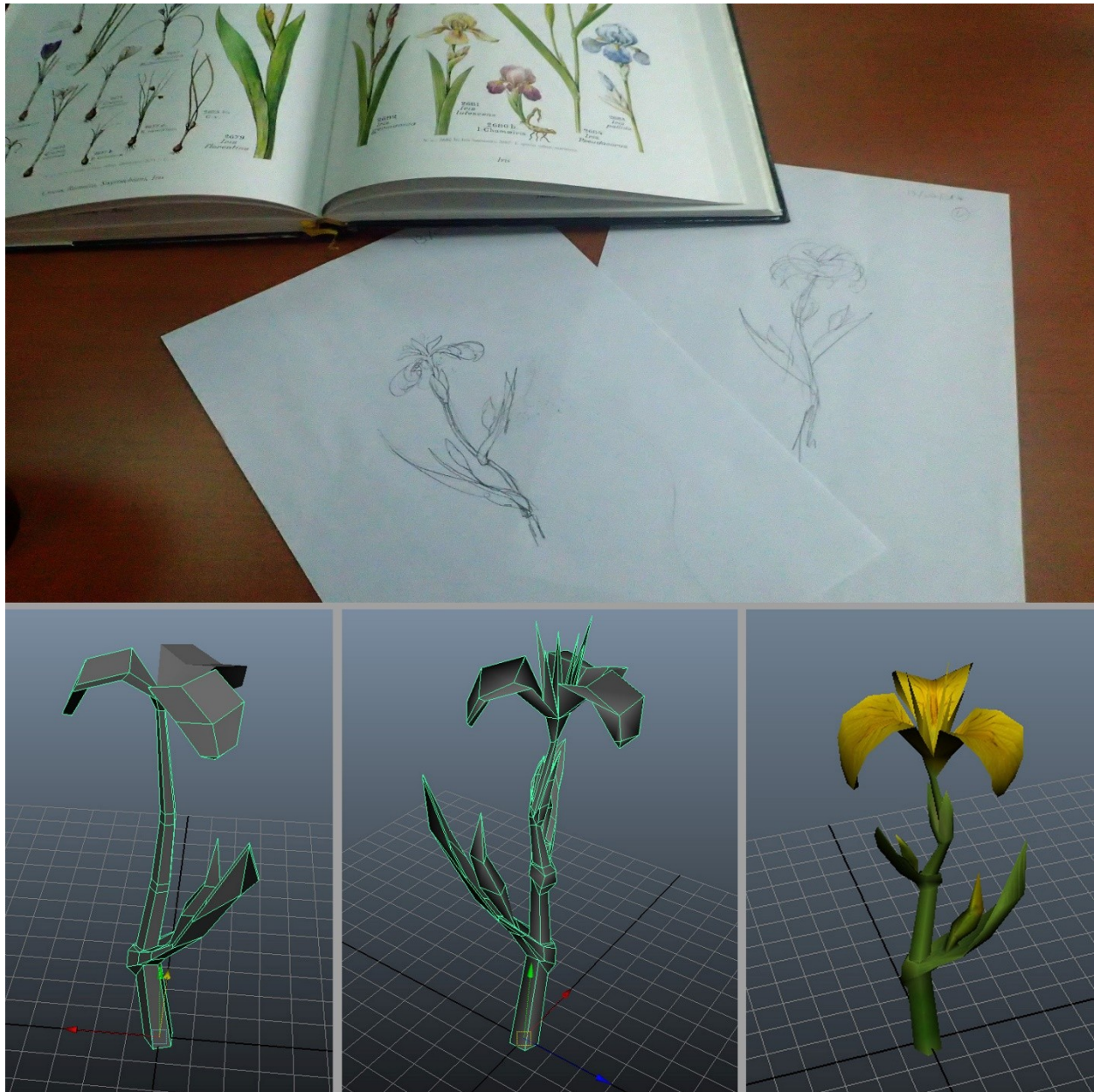
Figure 5 - étapes de la réalisation de l'iris, dessin, modélisation et textures dans le logiciel Maya.

L'ensemble des éléments ainsi réalisés a été intégré dans le logiciel de création de jeux vidéo Unity (Figure 4, vignette de gauche). En parallèle de leur intégration, Edwige Lelièvre a mis en place l'interactivité et développé plusieurs scripts dans ce but, chacun ayant un usage spécifique : « AffichageDisparitionTexte.cs », « Deplacement.cs », « DisparitionDesRonces.cs », « DisparitionDesRoncesFinale.cs », « EffetFlashforwardCamera.cs », « Introduction.cs », « MenuDebut.cs » 24 .