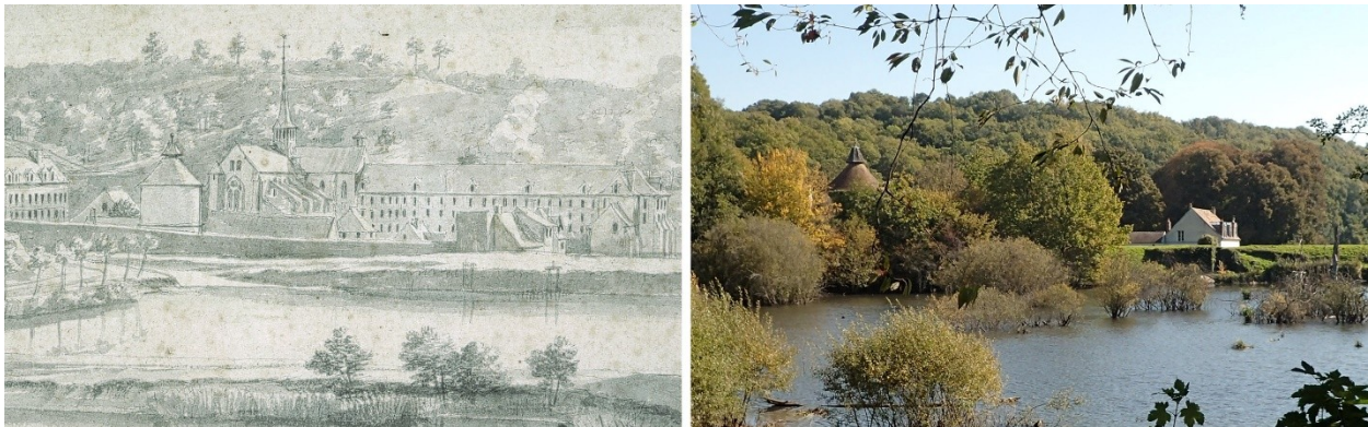
Figure 1 - Comparatif entre un dessin réalisé par Philippe de Champaigne représentant Port-Royal-des-Champs en 1654 6 et une photo représentant le même site aujourd'hui

Le terrain de Port-Royal des Champs présente dans ce contexte un intérêt de premier plan. Il s'agit en effet d'un patrimoine culturel et architectural religieux majeur qui a largement disparu. Cette grande abbaye cistercienne a en effet été démantelée, à la suite de l'opposition du groupe de Port-Royal, assimilé aux jansénistes, au système de monarchie absolutiste louis-quatorzien.