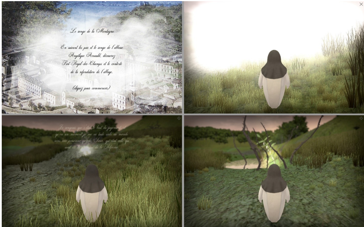
Figure 2 - Captures d'écran du prototype Vestigia-Songe (de gauche à droite et de bas en haut, vignettes a à d).

Le prototype réalisé est disponible gratuitement en ligne à cette adresse : https://edwige.itch.io/vestigia-songe 14 .