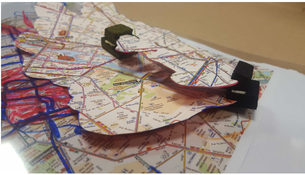
FIGURE 3. Processus de conception des isochrones étendues : prototypage papier collaboratif.