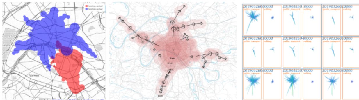
FIGURE 1. Extensions d'isochrones réalisés via une collaboration pluridisciplinaire (de gauche à droite) : visualiser l'intersection d'isochrones, simplifier leur représentation, et analyser leur symétrie par séparation visuelle.

Romain Vuillemot, Philippe Rivière, Anaëlle Beignon, Aurélien Tabard