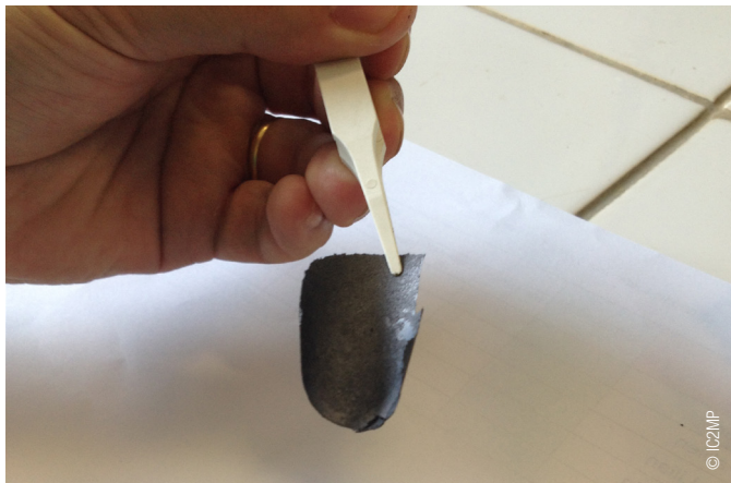
Obtention d'un film de MXène par simple filtration.

De nos jours, les matériaux lamellaires ou matériaux 2D, organisés en feuillets de quelques couches atomiques, aiguisent de plus en plus l'intérêt de la communauté scientifique. L'Institut de Chimie des Milieux et Matériaux de Poitiers s'est engagé dans la voie originale de la préparation des MXènes, des matériaux 2D aux propriétés riches et variées.