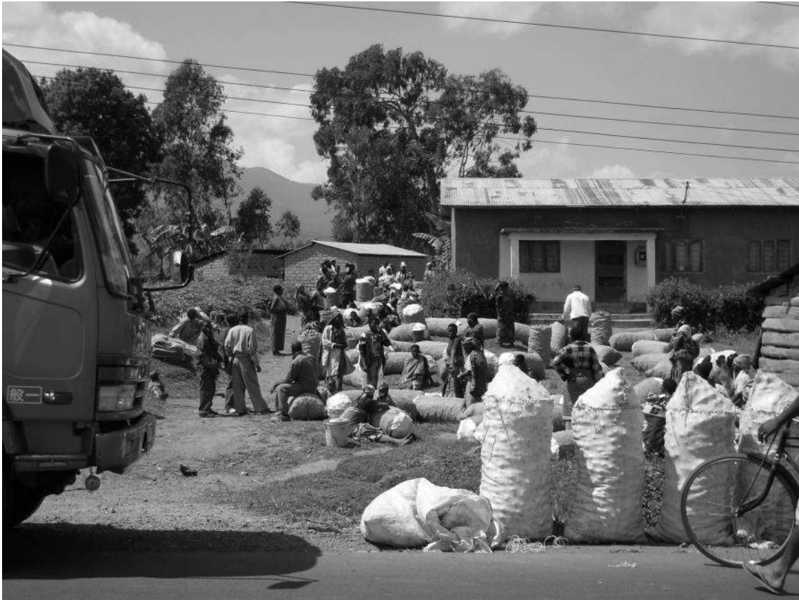
Figure 2 Main d'œuvre mobilisée pour la récolte et mise en sac de la pomme de terre, Uporoto Mountains (Racaud, 2011)

mètres d'altitude, se constituent des espaces de production consacrés à la pomme de terre. Cette culture nécessite un capital important pour financer l'utilisation intensive d'engrais, de produits phytosanitaires et de main d'œuvre. Elle entretient une force de travail faiblement rémunérée à la tâche, des services à l'agriculture. La photographie suivante montre l'importance de la main d'œuvre mobilisée lors des récoltes de pommes de terre. Les nombreux ouvriers ont rempli les sacs qui seront chargés dans les camions à destination de Dar es Salam, la capitale économique du pays.