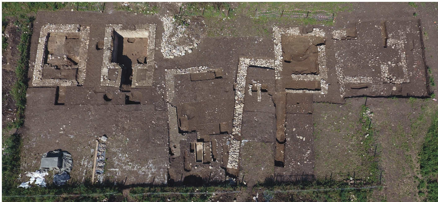
Fig. 2 – Vue aérienne des monuments funéraires de l'Antiquité tardive de Saint-Just de Valcabrère, dans la périphérie orientale de Lugdunum des Convènes (Saint-Bertrand-de-Comminges, Haute-Garonne). Les indices recueillis montrent que ces édifices ont été pillés environ un siècle après leur construction, dans la première moitié du v s..