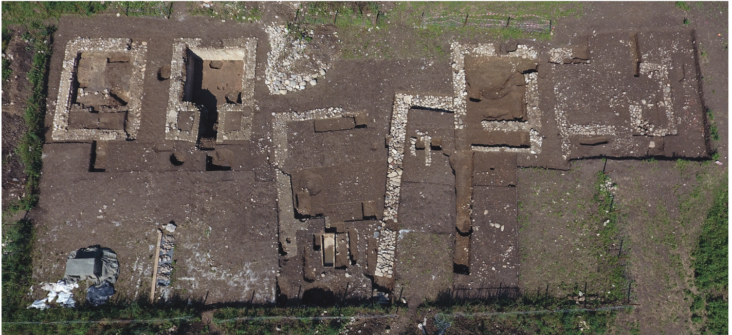
Fig. 2 – Vue aérienne des monuments funéraires de l'Antiquité tardive de Saint-Just de Valcabrière, dans la périphérie orientale de Lugdunum des Convènes (Saint-Bertrand-de-Comminges, Haute-Garonne). Les indices recueillis montrent que ces édifices ont été pillés environ un siècle après leur construction, dans la première moitié du v s..