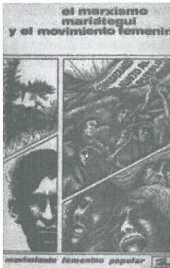
Carátula original del libro "El marxismo, Mariátegui y el Movimiento Femenino", 1974.