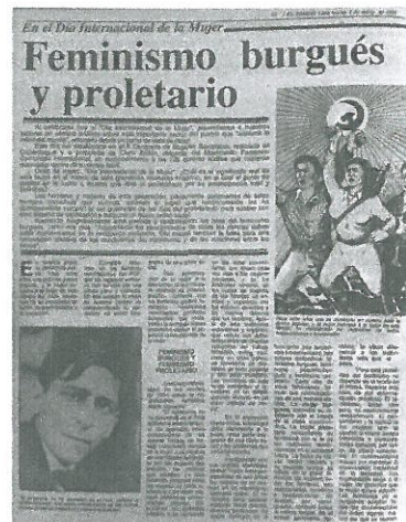
El Diario, 8 de marzo de 1988, Lima.