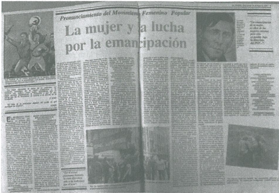
Pronunciamiento del Movimiento Femenino Popular, El Diario , 26 de mayo de 1988, Lima.