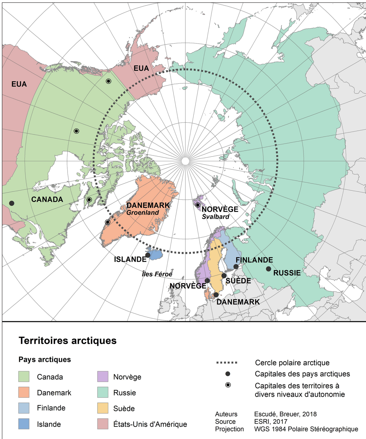
Figure 1. Les territoires arctiques (Escudé, Breuer, 2018)

Il rassemble toutes les organisations de populations autochtones représentées au sein du Conseil de l'Arctique.