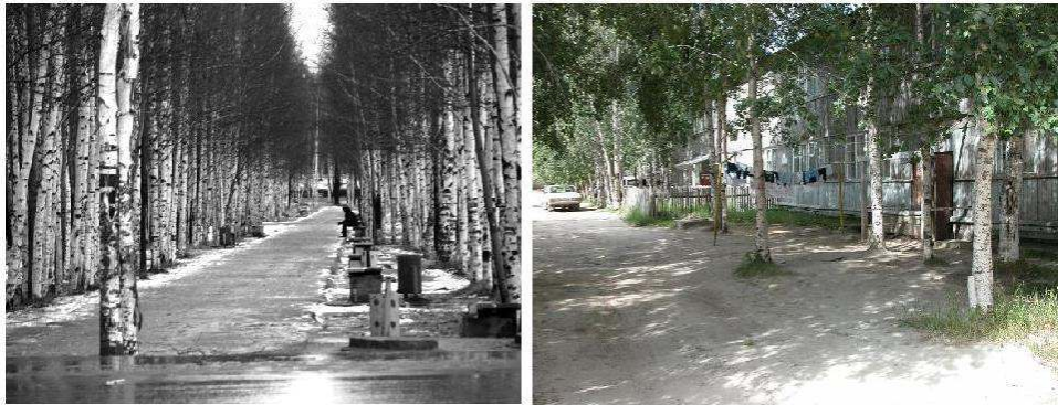
A gauche : Nefteïougansk, 61°06'N 72°36'E, pétrole, ville depuis 1967, 102 000 hab. (hiver 2000) – A droite : Noïabrsk, 63°11'N 75°27'E, pétrole surtout et gaz aussi, ville depuis 1982, 109 000 hab. (été 1999).