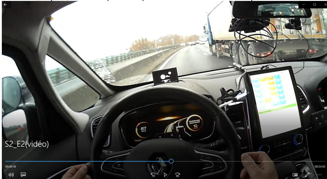
Photo 2 : Capture d'écran d'un enregistrement vidéo en vue subjective de l'observation in situ (étape 2), un exemple de dépassement automatisé d'un poids-lourd

Cette même situation est analysée avec le modèle SACI (Rabardel, 1995) pour caractériser les relations en jeu (cf. Figure 1 et Tableau 2).