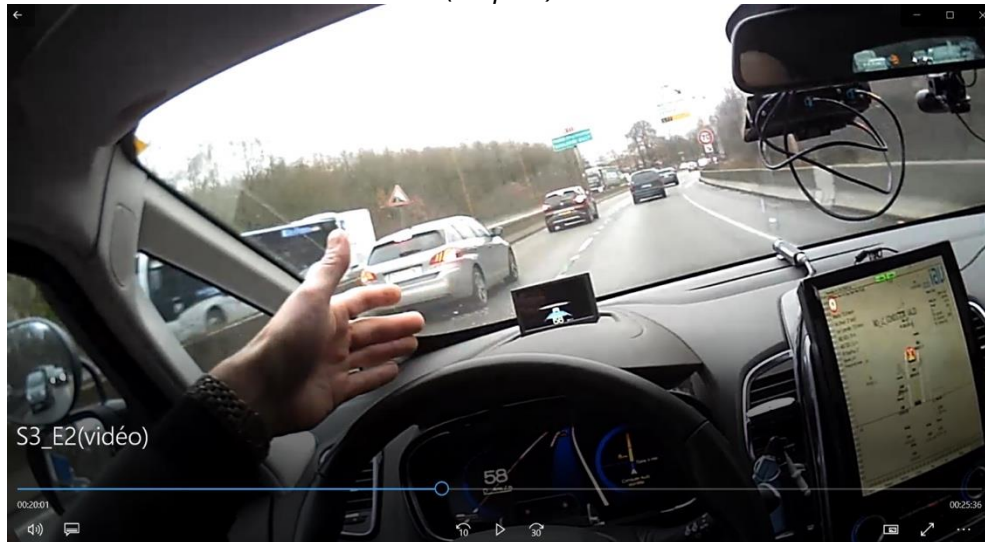
Photo 1 : Capture d'écran d'un enregistrement vidéo en vue subjective de l'observation in situ (étape 2)