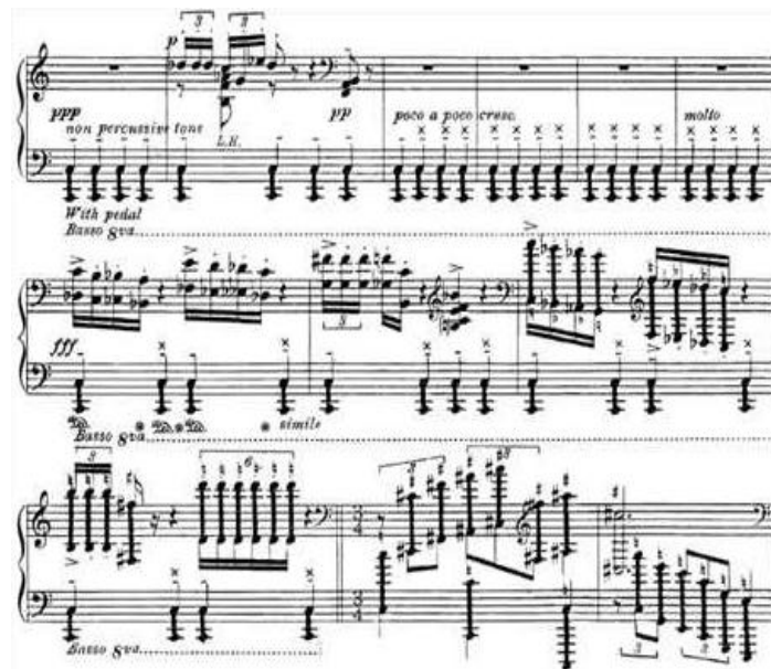
Exemple musical n°1 : extrait de la partition Dynamic Motion de Henry Cowell

En musicologie, plus spécifiquement, l'usage de la partition dite « traditionnelle » avec la portée à cinq lignes et l'écriture des notes telles que nous les connaissons tous aujourd'hui, sont jusqu'ici le seul réel moyen pour (1) composer de la musique, (2) se faire comprendre des autres musiciens dans le cas d'une interprétation donnée et (3) assurer une pérennité de l'œuvre. Toutefois, ce support est complexe et ne répondra plus tout à fait aux besoins et aux exigences des compositeurs du XX ème siècle 5 . L'utilisation de la partition traditionnelle est stricte et rigoureuse avec le souci de transcrire au mieux l'idée du compositeur 6 au risque de rendre le support presque illisible comme en témoigne Dynamic Motion de Henry Cowell composé entre 1914 et 1917. L'écriture des premiers clusters se révèle être au centre des questionnements du compositeur. Il parvient à proposer une nouvelle manière de « dessiner » les clusters sur la partition en les superposant avec des hauteurs d'octaves importantes. Toutefois, la partition se révèle être complexe à la lecture et nécessite un travail considérable de déchiffrage.