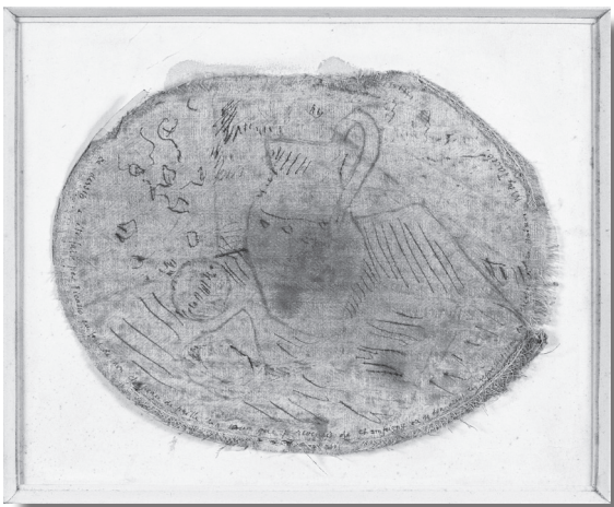
Chapeau de Max Jacob, portant une peinture ovale « Nature morte au pichet » par Picasso légendée au pourtour par le poète : « Ce dessin a été fait par Picasso au fond de mon chapeau de paille un jour que je revenais de Champigny où se donnaient des représentations de Théâtre de la nature. Max Jacob. »