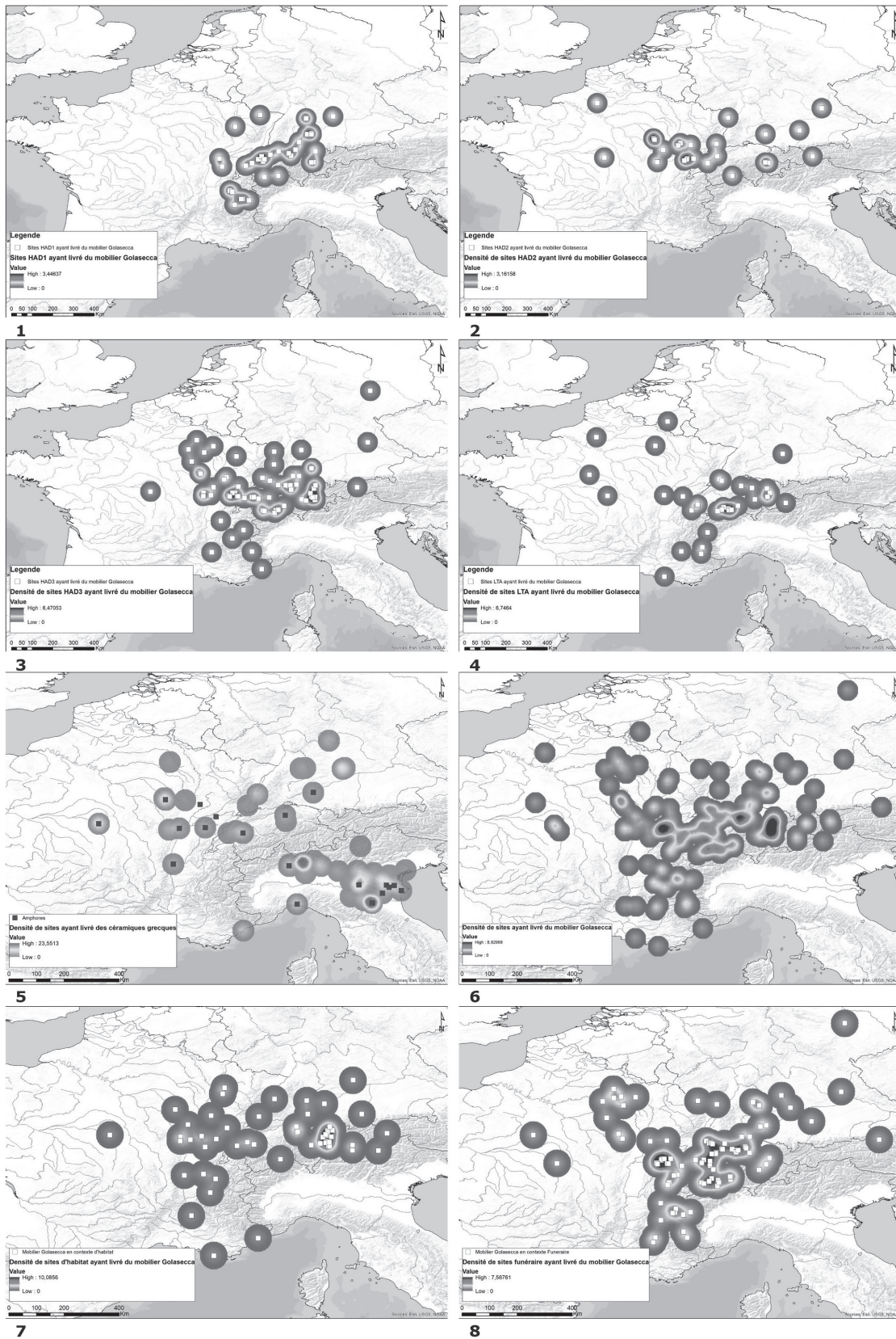
3. 1-4 : Cartes de densité par phase chronologique ; 5 : carte de densité et de nuage des points des importations méditerranéennes ; 6 : carte de densité de l'ensemble du corpus ; 7-8 : carte de densité par type de site (données : V. Cicolani, CAO : É. Tribouillard).