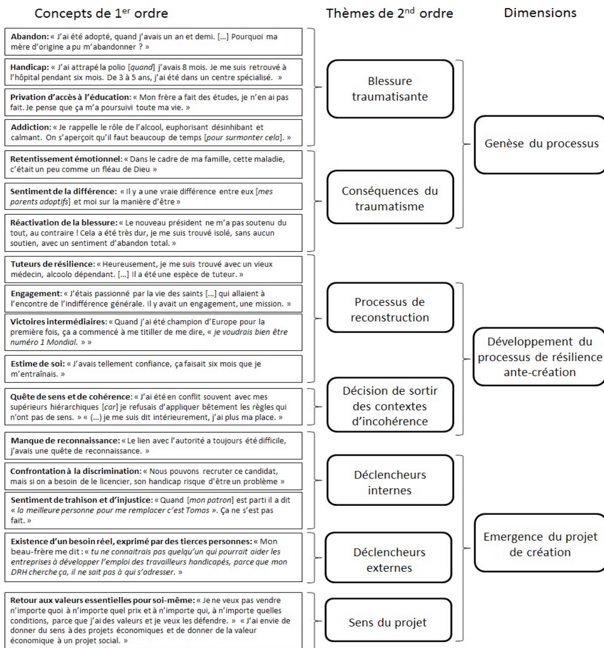
Figure 2. Processus de résilience contribuant au déclenchement de la décision d'entreprendre