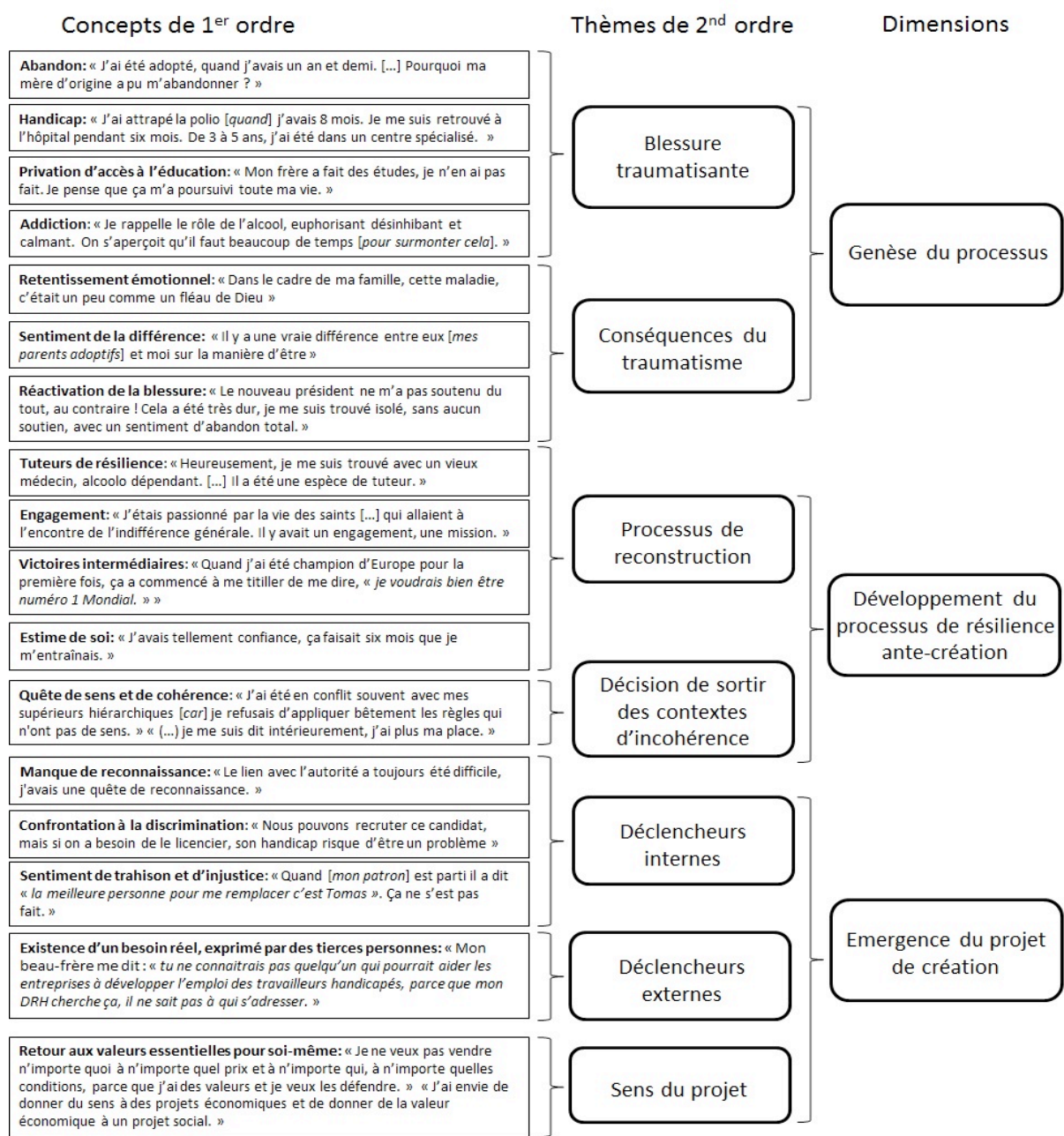
Figure 2. Processus de résilience contribuant au déclenchement de la décision d'entreprendre