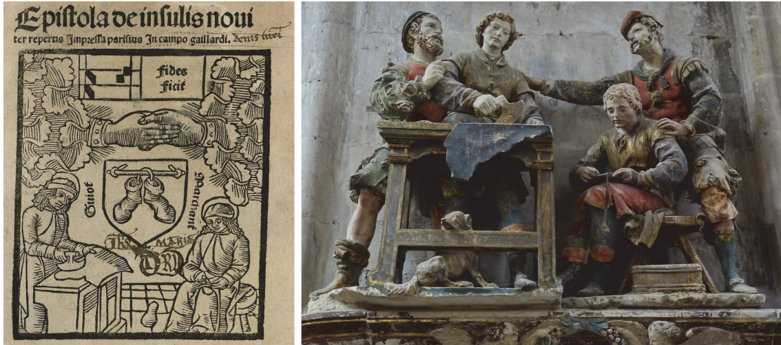
Figure 4 – Comparaison du bois gravé sur la page de titre de l'exemplaire de la troisième édition parisienne conservé à la Houghton Library, Inc 7988 (gauche) et du groupe sculpté figurant l'arrestation de Crépin et Crépinien dans l'église Saint-Pantaléon de Troyes (droite).

ceint leur tête, ont été représentés 22 . Cette évocation pourrait être liée au patronat des deux martyrs chrétiens sur les corroyeurs chargés de préparer le cuir des reliures. Mais, en l'espèce, le motif de l'écusson central brouille un peu cette lecture, par ailleurs, plus évidente dans une variante de cette marque utilisée pour d'autres ouvrages par l'imprimeur-libraire du Champ Gaillard 23 .