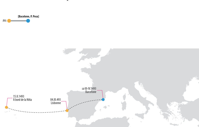
Figure 1 – Diffusion de la lettre de Colomb entre février et avril 1493.

problème. Selon le livre de bord du premier voyage – dont ne reste certes qu'une copie tardive recomposée entre 1515 et 1550 par le dominicain Bartolomé de Las Casas 8 –, Colomb avait quitté Lisbonne la veille, le 13 mars, et faisait alors voile vers Séville 9 . La redécouverte, en 1985 à Tarragone, d'une copie de la lettre de l'Amiral aux Rois catholiques, a priori celle-là même mentionnée par le billet de la missive à Santángel, suggère une explication. Elle porte en effet la date du 4 mars 1493, jour auquel, selon le journal de bord, la Niña fit son entrée dans l'estuaire du Tage 10 . C'est donc peut-être là une erreur du prote de l'édition barcelonaise qui aurait composé « quatorze días » au lieu de « quatro días ». Quant à l'impression par Posa, elle eut certainement lieu entre les derniers jours de mars et les tout premiers d'avril.