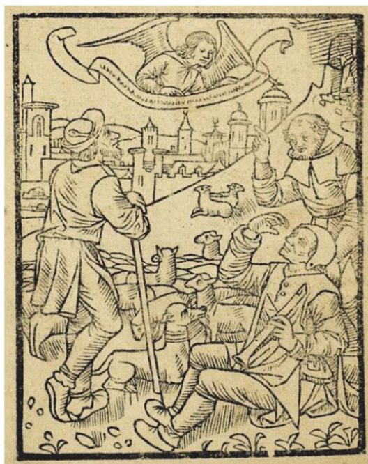
Figure 5 – Bois gravé au verso du premier feuillet de l'exemplaire de la deuxième édition parisienne conservé à la John Carter Brown Library [R] H493, C718d10 ( visionneuse).