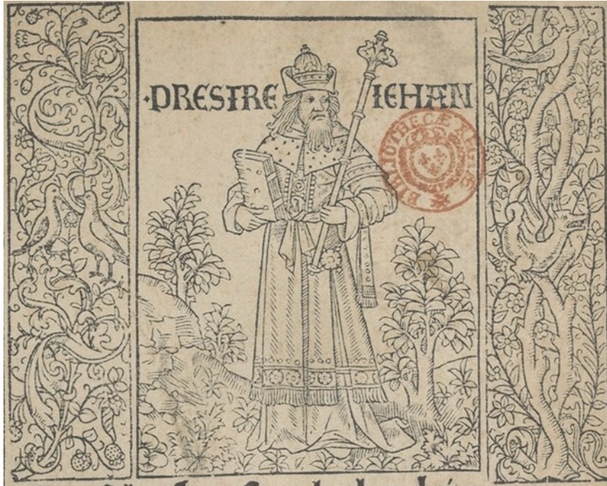
Figure 7 – Marque typographique de Guyot Marchant dans l'exemplaire de Le Compost et kalendrier des bergeres (1499) conservé à la Bibliothèque nationale de France, Rés. V. 275 ( visionneuse)

Les autres expéditions colombiennes – 1493-1496, 1498-1500, 1502-1504 – ne bénéficièrent pas de la même publicité. Il existe bien un récit du second voyage publié à Pavie en 1494-1495 par Nicolò Scillacio, et une lettre-relation de Colomb sur son quatrième voyage imprimée à Venise en 1505 36 . Mais aucun ne connut la fortune éditoriale de la lettre de 1493. Cette dernière continua à être imprimée et réimprimée en Europe, bien après 1493, à Valladolid ( ca 1493-1497), à Bâle (1494), à Florence (1495) ou à Strasbourg (1497). Si, dans leur forme matérielle, ces éditions se présentent toujours comme des non-livres, étaient-elles encore vraiment des pièces de circonstances ? Rien n'est moins certain.