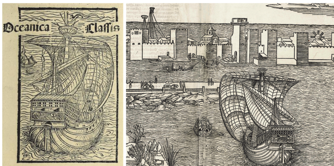
Figure 6 – Comparaison des bois gravés de l'édition bâloise, 1493 (gauche) et de la Peregrinatio in Terram Sanctam , 1486 (droite).

Les deux dernières éditions parisiennes sont ainsi, avec celle de Bâle, les seules, en prose, illustrées. Cependant les quatre gravures insérées par l'imprimeur helvète – Jakob Wolff, Michael Fürter ou Johann Bergmann de Olpe –, bien qu'en partie copiées sur celles de la Peregrinatio in Terram Sanctam publiée à Mayence en 1486, illustraient, elles, explicitement l'arrivée de Colomb dans les « îles de la mer de l'Inde 25 » ( visionneuse ).