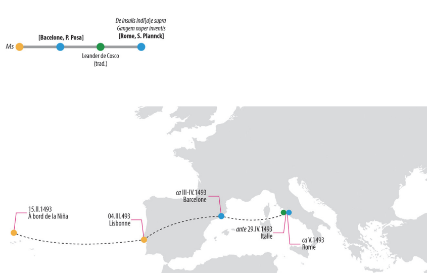
Figure 2 – Diffusion de la lettre de Colomb entre avril et mai 1493.