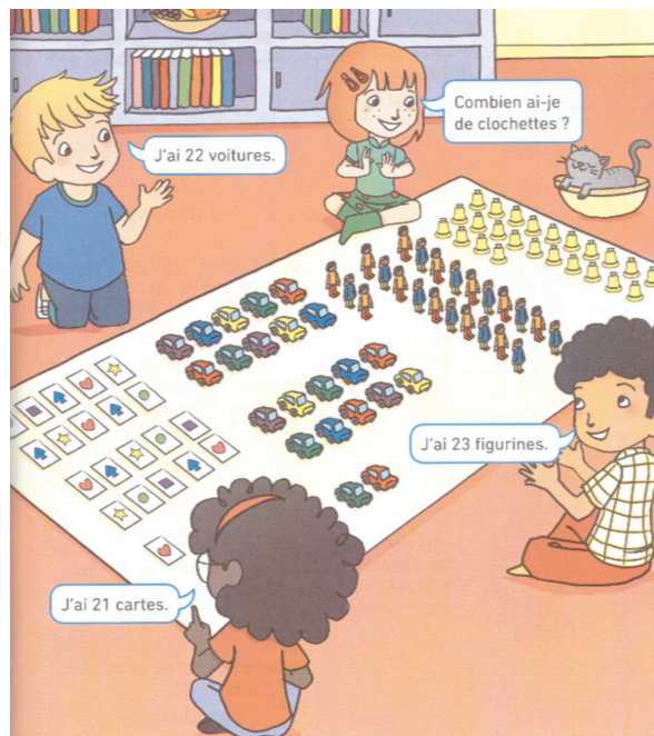
Figure 1 : Extrait du fichier de l'élève, séance 79

Regardons alors de manière plus précise le découpage d'une séance, à partir de celle décrite dans l'annexe de cet article (cf. p. 12).