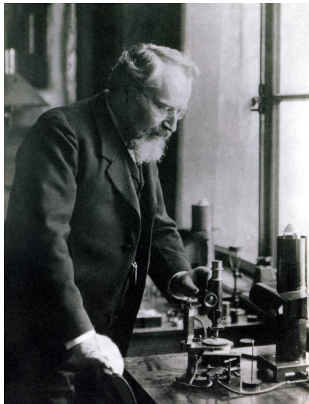
1. Otto Lehmann en 1907, dans son laboratoire à l'université de Karlsruhe.

La trajectoire des cristaux liquides — d'une racine charnue, douce et sucrée, à un écran plat — débute par une lettre, seize pages de caractères gothiques, que Reinitzer écrit le 14 mars 1888 à un physicien allemand d'Aix-la-Chapelle : Otto Lehmann. Le botaniste lui raconte des expériences extraordinaires sur ses cristaux extraits de la carotte. Plus un chercheur est étonné par ce qu'il observe, plus il est content. Reinitzer est content : les cristaux ne se comportent pas du tout comme il pouvait s'y attendre. Ils deviennent fluides à 145,5°C mais en conservant leur couleur bleutée, perdue plus tard, à 178,5°C. Or un cristal, lorsqu'il est coloré, perd solidité et couleur à une seule et unique température. Les connaissances académiques de l'époque sont sans équivoque. Ce comportement surprenant, Reinitzer s'est arrêté dessus et le relate en détails dans sa lettre.