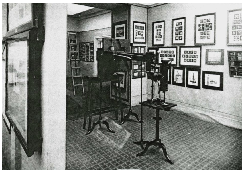
4. L'exposition organisée à la Sorbonne par Otto Lehmann en 1909.

Sa conférence fut un triomphe. Il ne s'interrompait que lorsqu'il y était contraint par les applaudissements nourris d'un auditoire enthousiaste. «Une victoire à Paris de la science allemande !» s'exclamait-on dans le même journal, écho à peine feutré des vieilles rancœurs envers les Français.