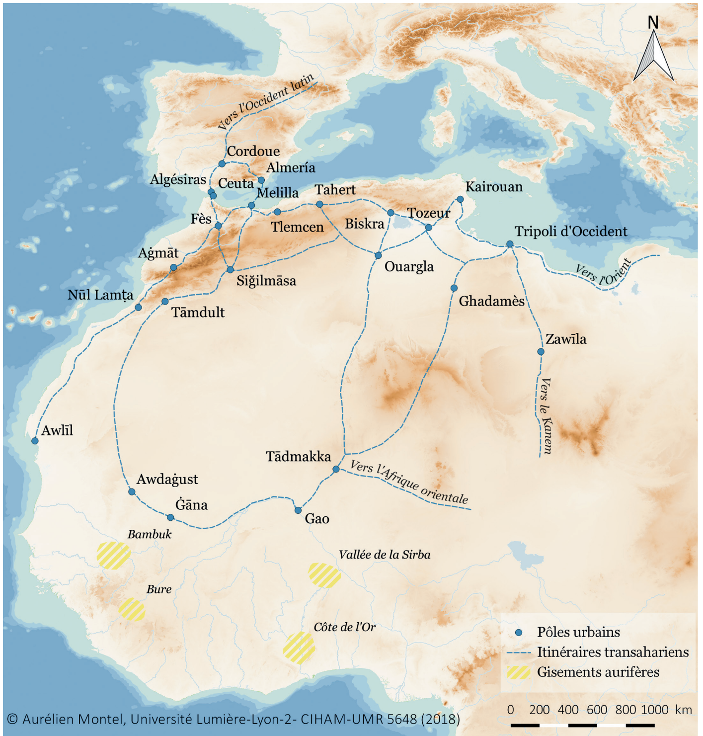
Fig. 1 - Les itinéraires de l'Occident musulman et du bilād al-Sūdān d'après les géographes arabes (IV e /X e siècle). (Dao : A. Montel)