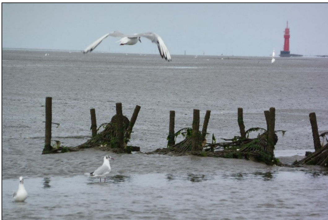
Photo 6 - Le banc de sable a bougé sous l'effet d'une tempête, le chenal tidal s'est décalé, le pêcheur a déplacé son territoire de pêche, abandonnant ses anciens engins, ensablés, au large de Wremen.