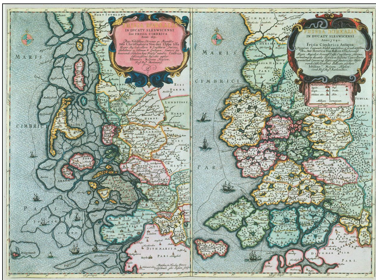
Figure 2 - La côte des Wadden de la Frise Septentrionale et son recul, à deux dates différentes : 1240 (droite) et 1651 (gauche).

moyen du trait de côte, laissant apparaître qu'Helgoland était autrefois rattachée au continent (la côte aurait donc reculé d'au moins 20 km en 400 ans, comme le montre la figure 2).