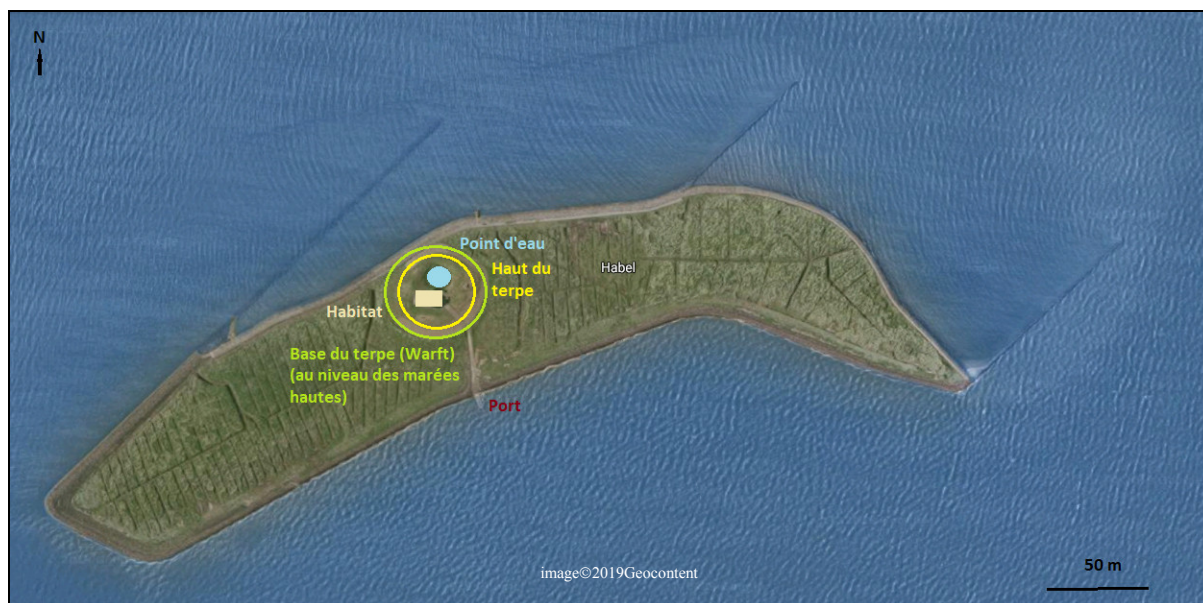
Figure 3 - La Hallig de Habel, dans les Wadden.