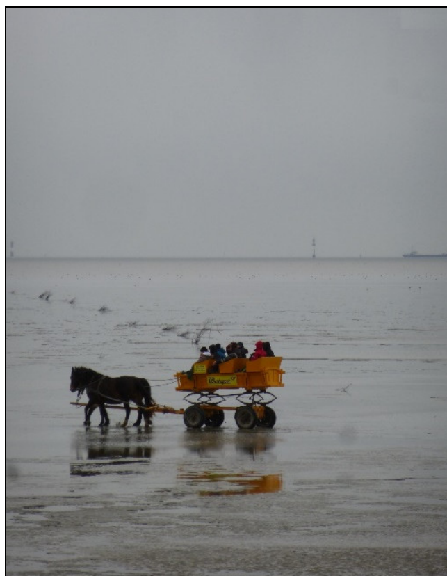
Photo 2 - La malle-poste, à travers le Watt.

Jusqu'au Moyen-Âge, des peuplements épars sont présents, regroupés en quelques petites agglomérations. Rapidement, avec l'essor du commerce, certaines villes vont voir leur population grandir au fil des siècles, dynamisant avec elles toute une région (la ville de Emden par