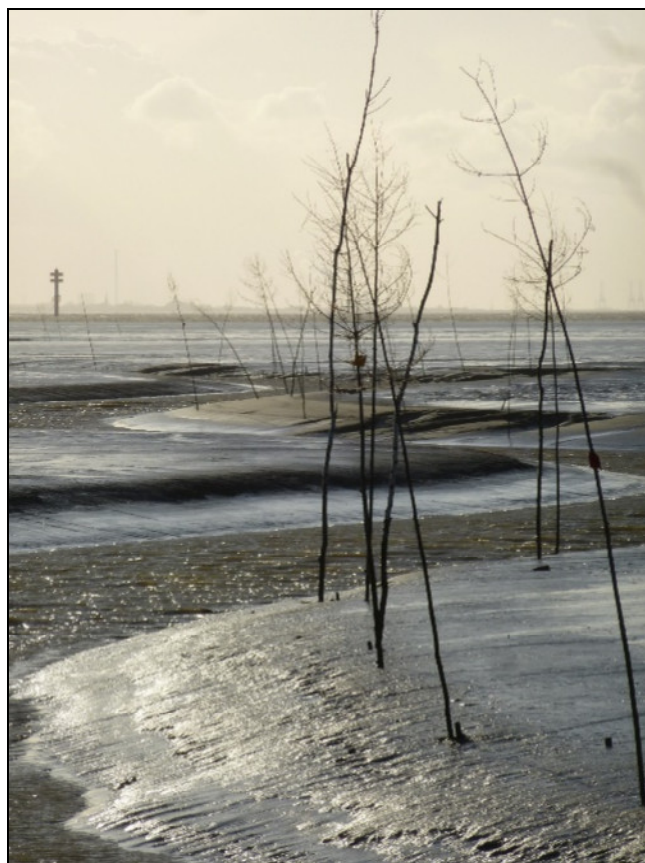
Photo 1 - Vasière et chenaux de marée balisés par des bouleaux près de Wremen.

du Gulf Stream, même légèrement affaibli après le contournement de l'archipel anglo-saxon. Les précipitations sont abondantes et les coups de vent et tempêtes fréquents et violents (J. DIPPNER et al. , 2012).