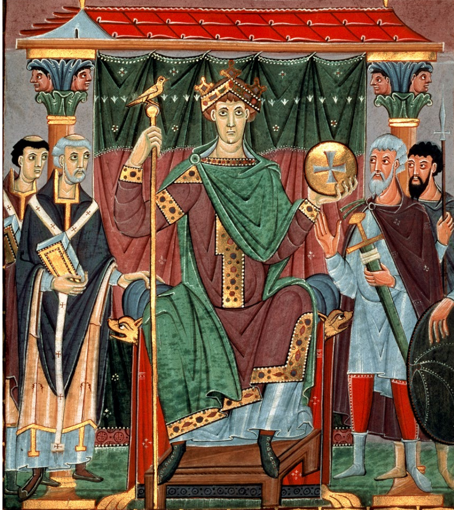
▲ C'est grâce à Otton III, empereur des Romains, au centre sur cette enluminure du X e siècle, que Gerbert d'Aurillac (à gauche) devient le pape Sylvestre II en 999.

L'instrument de Gerbert n'est pas une simple variante de l'abaque classique, grec ou romain, mais bien une adaptation du calcul arabe se déroulant avec la numération positionnelle. Grâce à des colonnes, l'abaque de Gerbert rend possible un calcul sans recourir au zéro, qui est remplacé par un espace vide. Le zéro – qui