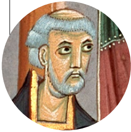
▲ Gerbert d'Aurillac.

Au X e siècle, Gerbert d'Aurillac, moine d'origine modeste, devient un savant majeur de son époque. Fêré de mathématiques, il invente un outil de calcul qui introduira les chiffres arabes en Occident. Ce qui n'entravera pas son accession au trône pontifical.