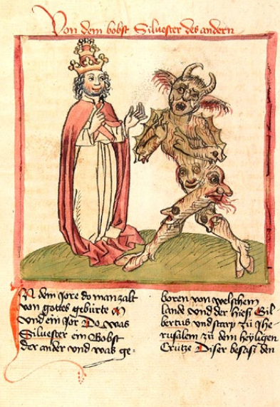
▲ Comment expliquer le parcours du moine Gerbert ? De folles hypothèses ont circulé au long des siècles. Sur cette enluminure du XV e siècle, devenu pape, il pactise avec le diable.