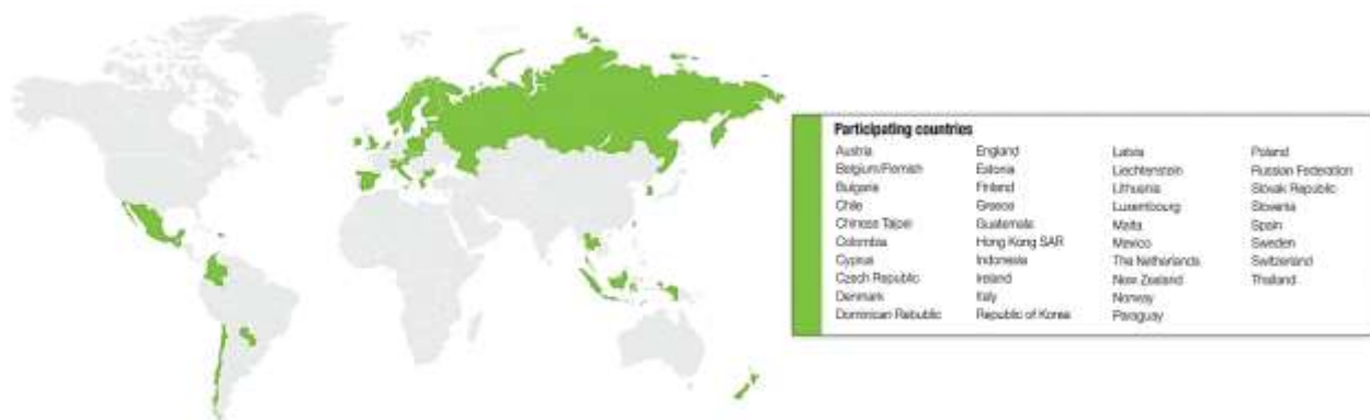
Figura 5. Países participantes en ICCS 2009.

países de la región asiática, 26 de Europa y uno de Australia (Ver Figura 5) (Ainley et al., 2009; ICFS, 2017).