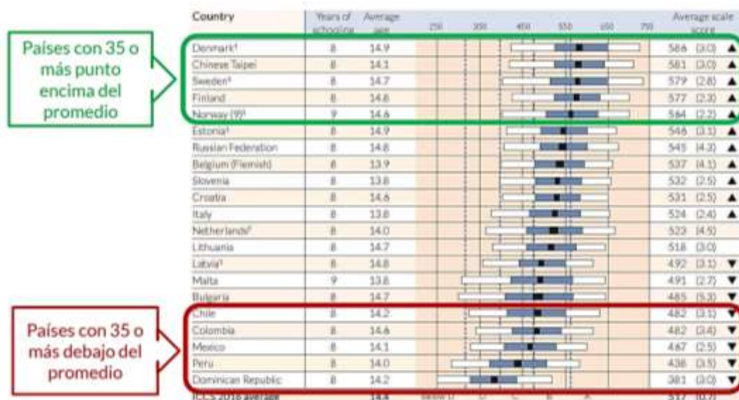
Figura 6. Promedios nacionales de conocimiento cívico ICCS 2016. Fuente: Tomado de Schulz et al. (2018).

En la prueba ICCS 2009 para la región asiática la mayoría de los estudiantes encuestados reflejaron un sentido de identidad y expresaron altos niveles de confianza en los gobiernos locales (Ainley et al., 2009). Por otra parte, el puntaje promedio en todos los países de América Latina osciló entre 380 y 483; Chile, Colombia y México tuvieron puntajes promedio de conocimiento cívico significativamente más altos que el promedio latinoamericano (Schulz et al., 2011). Sin embargo, los estudiantes colombianos reflejaron altos déficits en conceptos relacionados con los derechos de los ciudadanos (Reimers, 2007), y aunque en la Prueba ICCS 2016 Colombia presentó un aumento de 20 puntos sigue encontrándose en los países que tienen 35 puntos o más por debajo del promedio total, tal como se muestra en la Figura 6 (Schulz et al., 2018).