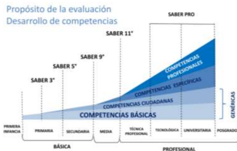
Figura 1. Evaluación de competencias en Colombia.

Teniendo en cuenta los Estándares Básicos de Competencias, los cuales determinan las capacidades que se espera desarrollen los estudiantes en los diferentes niveles educativos, el ICFES diseñó las Pruebas Saber para evaluar las competencias básicas, ciudadanas, específicas y profesionales (Ver Figura 1).