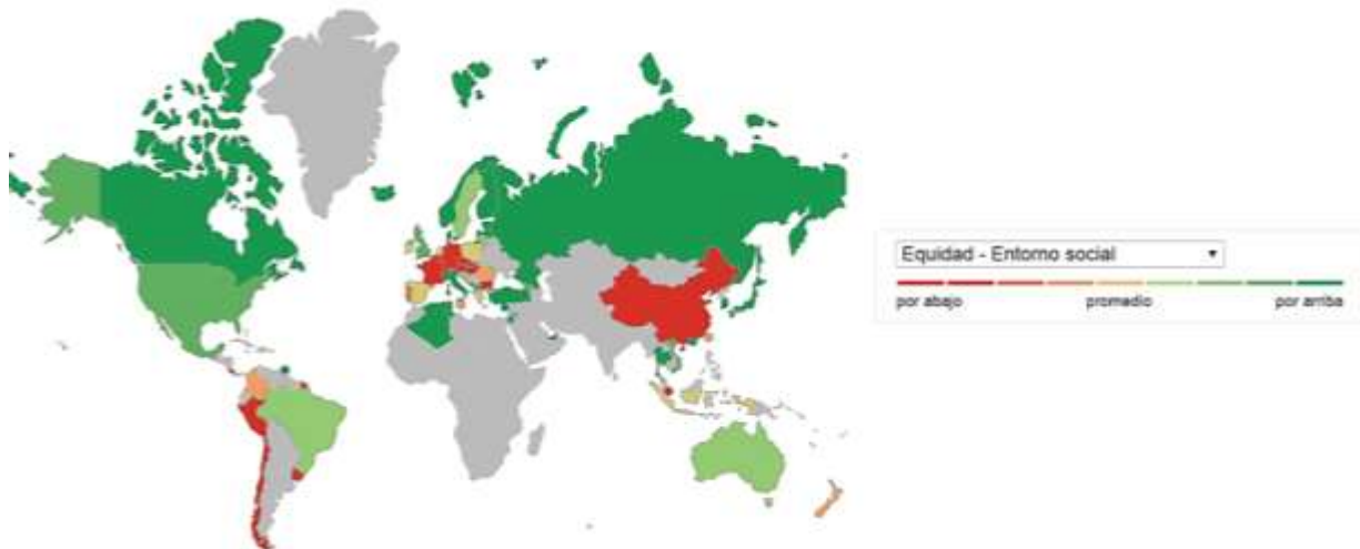
Figura 3. Resultados pruebas PISA 2015 para Colombia. Tomado de OCDE (2018).

Las pruebas PISA (Programme for International Student Assessment) tienen como objetivo evaluar el dominio de los procesos, el entendimiento de conceptos y la habilidad de actuar en varias situaciones; en las áreas de lectura, matemáticas, competencias científicas y equidad. Su población objetivo son los estudiantes de 15 años, los cuales se encuentran a punto de iniciar la educación post-secundaria o de integrarse a la vida laboral; en promedio, se utilizan muestras representativas entre 4.500 y 10.000 estudiantes por país. Aunque Colombia escaló posiciones en las pruebas PISA 2015, los resultados en el área de equidad se siguen encontrando por abajo del promedio global (Ver Figura 3) (OCDE, 2018).