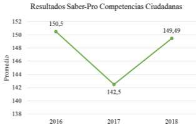
Figura 2. Resultados Competencias Ciudadanas. Fuente: Adaptado de ICFES (2018a).

Además, considerando que la población objetivo del proyecto DIDACTIC corresponde a los estudiantes universitarios, se presta atención especial a los resultados de las pruebas Saber Pro. Tal como se muestra en la Figura 2, el puntaje promedio en el módulo de competencias ciudadanas a nivel nacional en los últimos tres años no supera los 150,5 puntos (sobre 300 posibles), siendo este módulo genérico el que posee el menor número de estudiantes en el máximo nivel de desempeño (3%) y el que registró un mayor porcentaje de estudiantes en el menor nivel (31%).