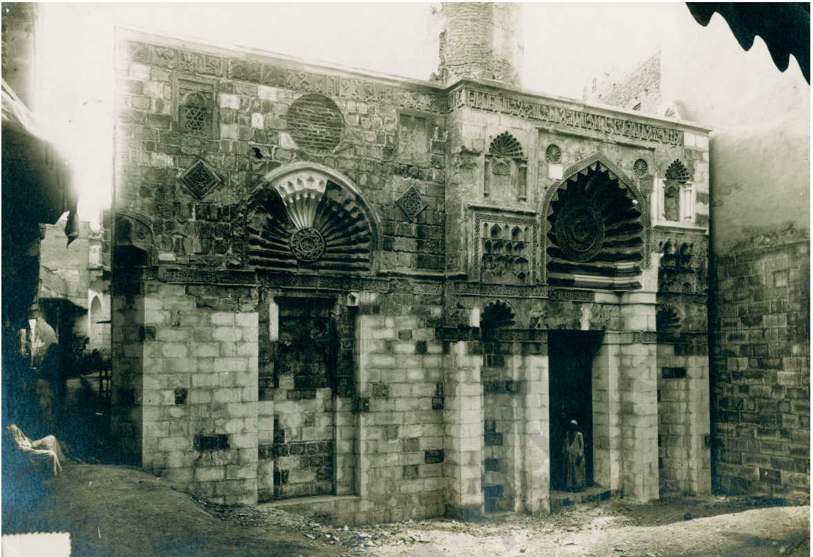
Fig. 5. Keppel Archibald Cameron Creswell, Façade de la mosquée al-Aqmar.