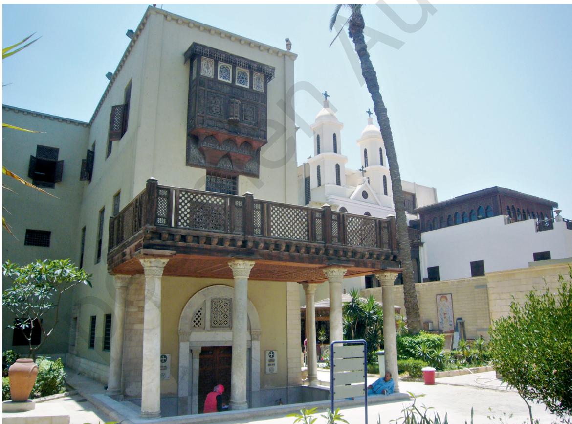
Fig. 2. Porche d'entrée du Musée copte.

Les élévations réalisées sous la direction d'Achille Patricolo sont présentées par Simaïka comme étant dans un « style copte » 64 . Il mentionne très probablement et plus spécialement ici le porche abritant le nouvel accès au musée et décoré de « six colonnes en marbre, surmontées de chapiteaux en forme de corbeille avec oiseaux et croix, reproduits d'après le N° 3507, exposé dans la salle 4 » 65 (fig. 2). Les références à ce style sont nombreuses et les dessins inédits conservés aux Archives de la Citadelle révèlent l'inventivité des architectes en matière d'élévations envisagées pour le bâtiment. Elles révèlent également la volonté du premier directeur du musée de célébrer le glorieux passé de la communauté chrétienne en Égypte.