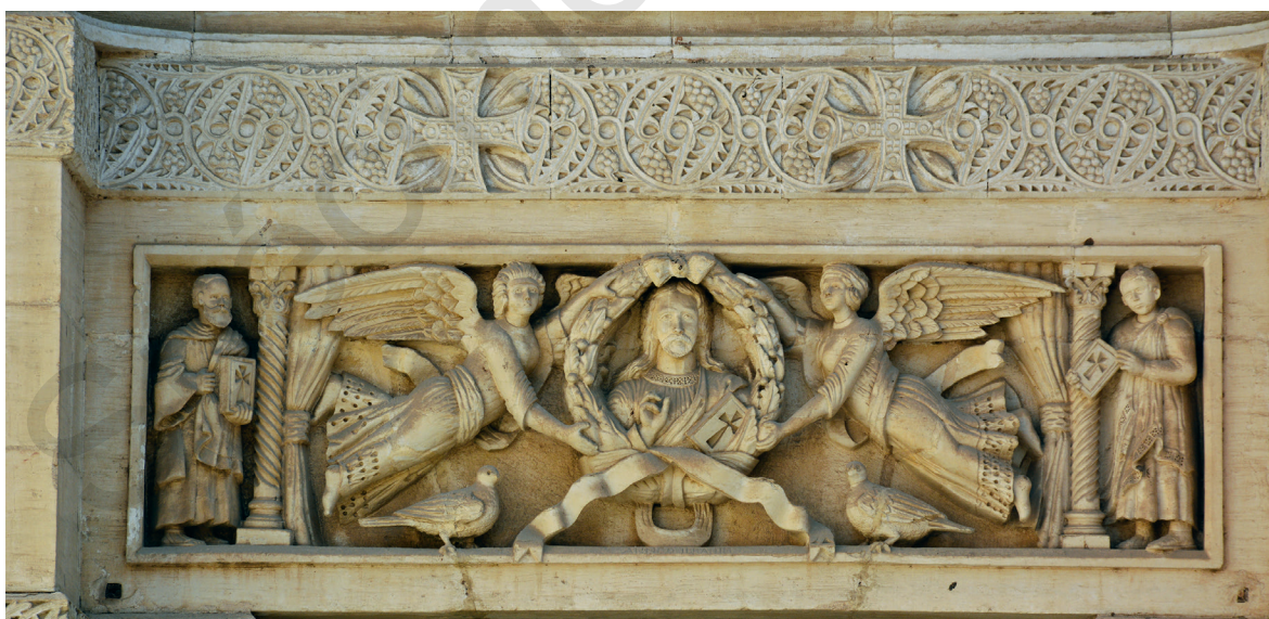
Fig. 8. Façade néo-fatimide du Musée copte (détail du linteau central).