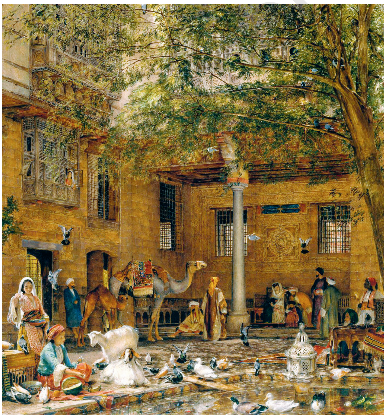
Fig. 13. John Frederick Lewis, Study for "The Courtyard of the Coptic Patriarch's House in Cairo" , v. 1864, huile sur bois, No1688, Londres, Tate.