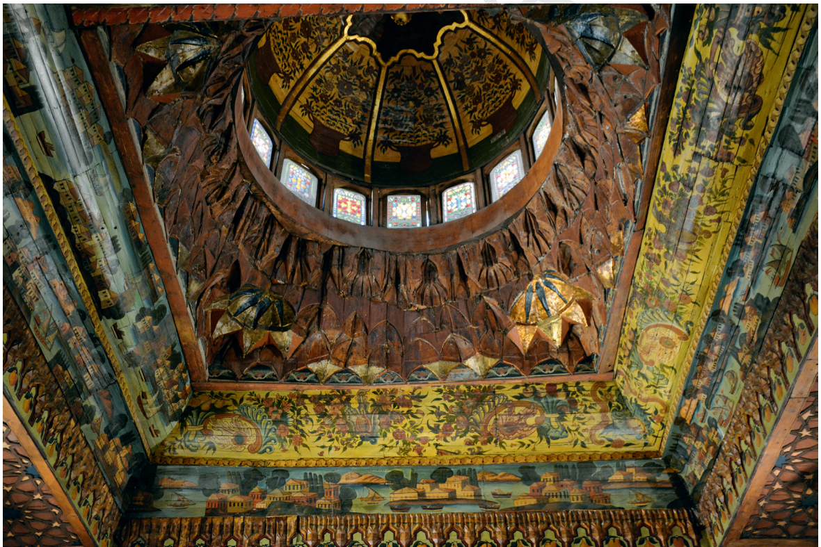
Fig. 16. Plafond de la salle Mounira (détail de la coupole centrale), XVIII e siècle, Musée copte.

L'usage abondant de remplois au Musée copte tend à créer une confusion entre contenant et contenu. L'originalité de ce musée tient-elle à la plus grande réunion d'objets liés à la communauté chrétienne en Égypte ou à la célébration d'un bâtiment vantant les revendications d'une minorité ?