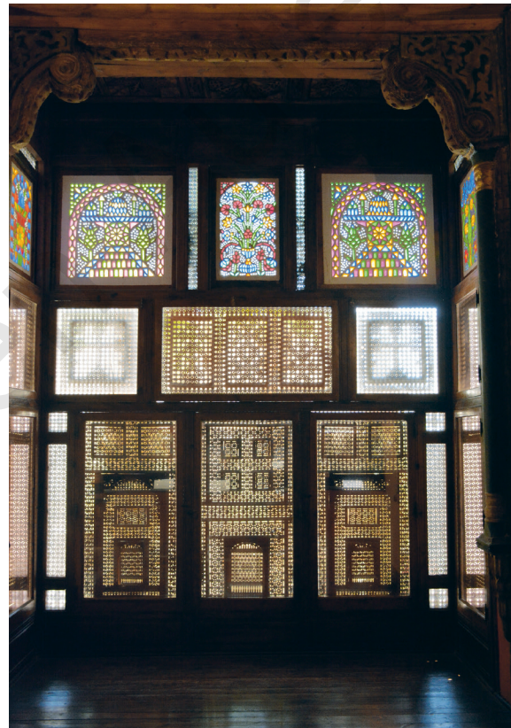
Fig. 15. Moucharabieh de la salle 17 du Musée copte (vue intérieure).