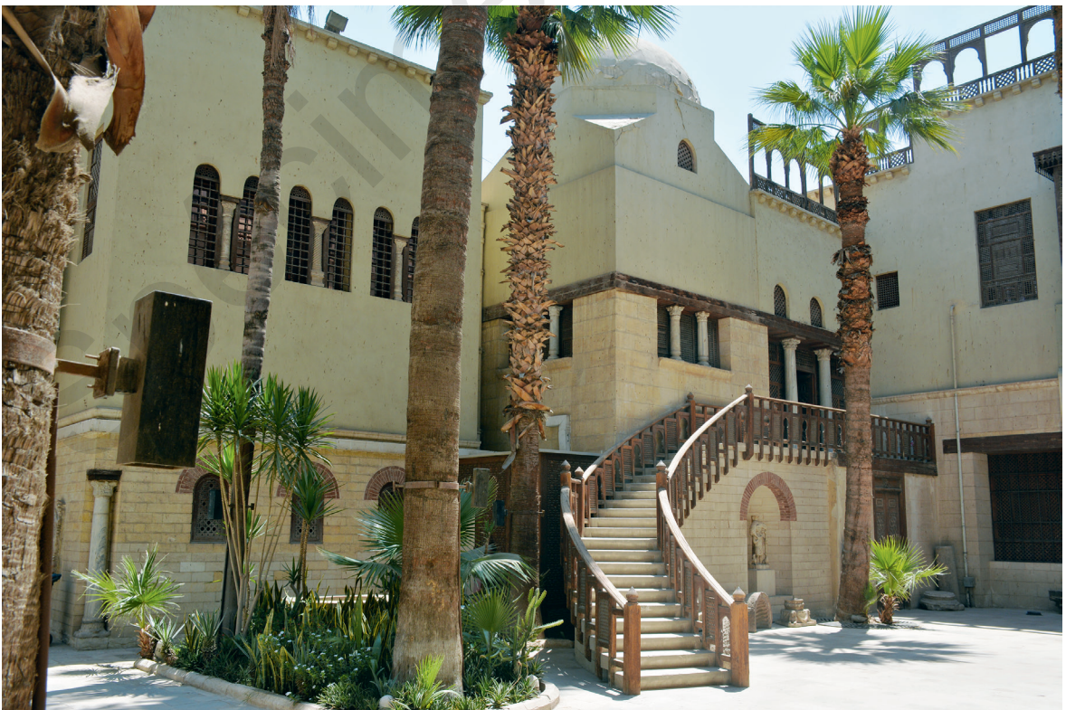
Fig. 6. Cour intérieure de l'« ancienne aile », vue de l'escalier et de la coupole.