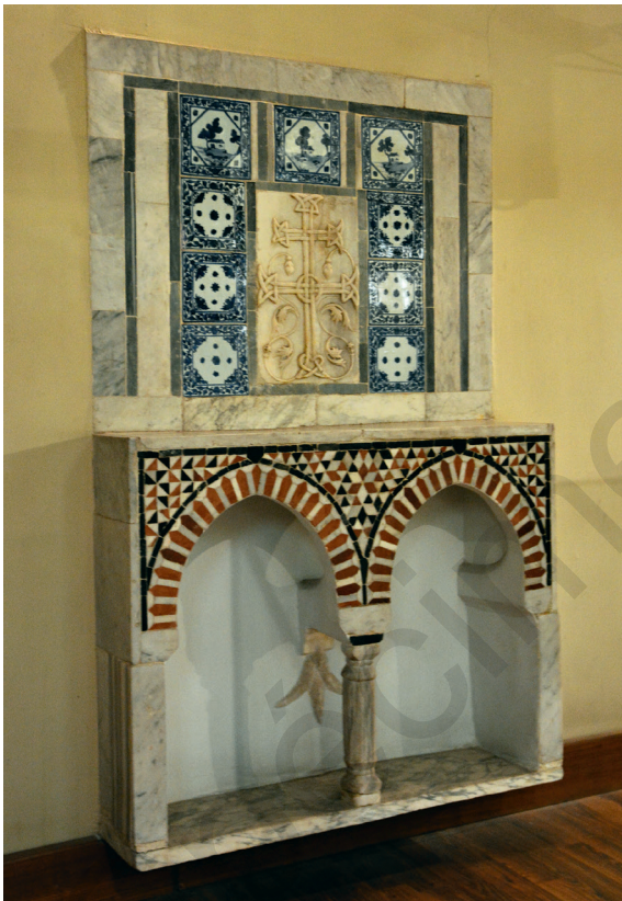
Fig. 14. Suffa , Musée copte.

Déjà évoquées précédemment dans la description de la résidence et dans le tableau de Lewis, les structures de bois de type moucharabieh ont fait l'objet d'un soin particulier par Marcus Simaïka Pacha. Issues de Ḥārat al-Rūm 112 et de différents palais démantelés ayant appartenu à des chrétiens 113 , elles ont été, pour la plupart, soigneusement remontées sur les vastes baies de l'« ancienne aile » 114 (fig. 15). Sauvées des flammes qui les guettaient, elles furent même trop nombreuses. Inventoriées dans les collections, certaines sont ainsi aujourd'hui abandonnées, dans un piètre état, dans la réserve externalisée du Musée copte se situant à Fustat 115 . Leurs décors, dans les parties supérieures, figurent des vases de fleurs, des croix ou des passages des psaumes. Certaines sont également ornées de vitraux colorés.