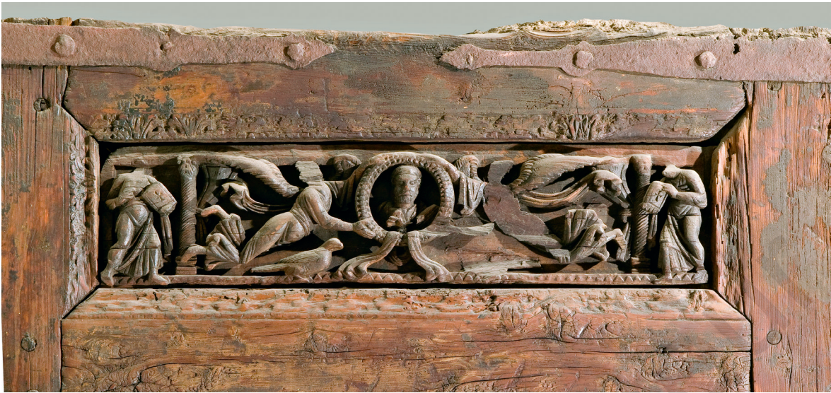
Fig. 9. Porte à deux vantaux (détail du décor du vantail droit), M.C. 738, Le Caire, Musée copte.