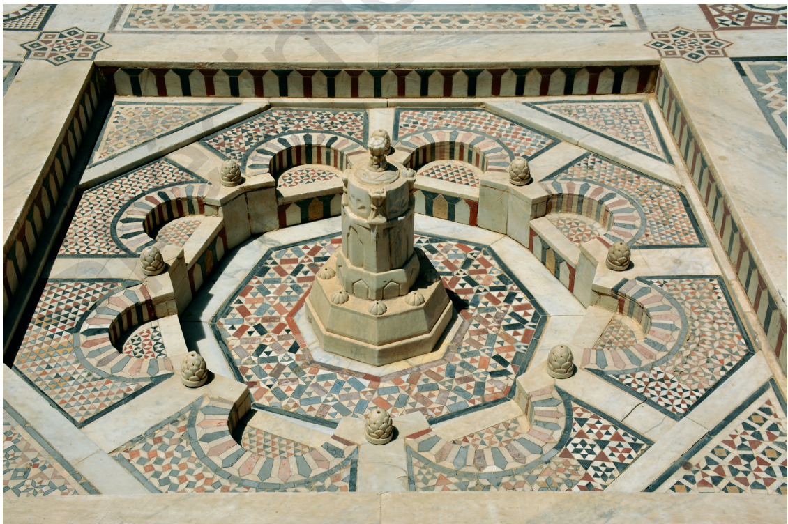
Fig. 11. Fasqiyya de la cour devant la façade néo-fatimide du Musée copte.