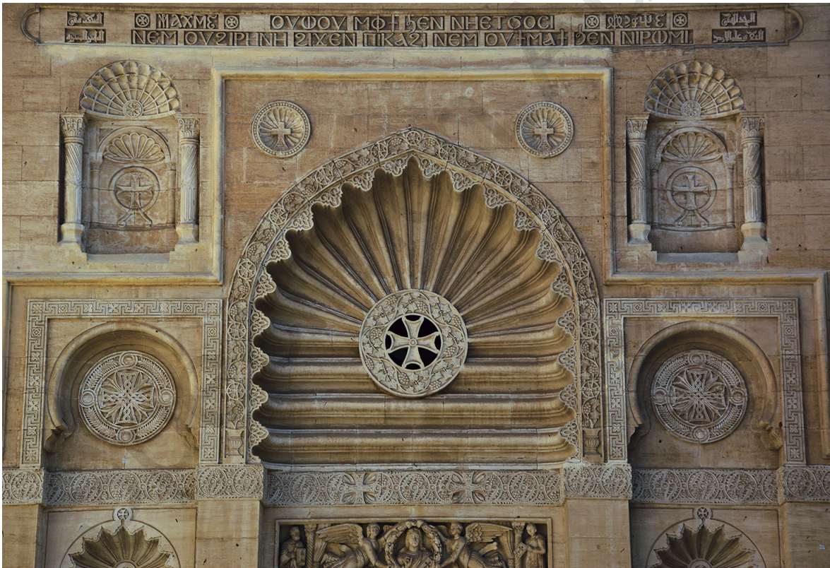
Fig. 7. Façade néo-fatimide du Musée copte (détail).

Si l'ensemble de la structure correspond en effet à la façade de la mosquée fatimide – avec la restitution de la partie droite par le Comité –, la plupart des motifs ont été remplacés par un vocabulaire iconographique chrétien. La partie centrale est percée d'une grande porte surmontée d'une arche en carène à motifs radiaux comme sur le modèle original, mais c'est un médaillon orné d'une croix pattée entourée de rinceaux de vignes qui trouve sa place au centre (fig. 7). Deux niches sont placées toujours de part et d'autre de la porte, mais ce sont de grands médaillons crucifères entourés de lauriers qui remplacent les muqarnas . Le motif de la croix remplace également les ornements de plantes du décor original, les lampes suspendues et la balustrade couronnant la façade. De même, les deux grandes niches sur les côtés sont surmontées d'arches en carène au centre desquelles sont placés des médaillons ornés de croix pattées entourées de rinceaux de vignes. Des éléments de végétaux stylisés et des frises épigraphiques en copte et en arabe viennent compléter cet ensemble.