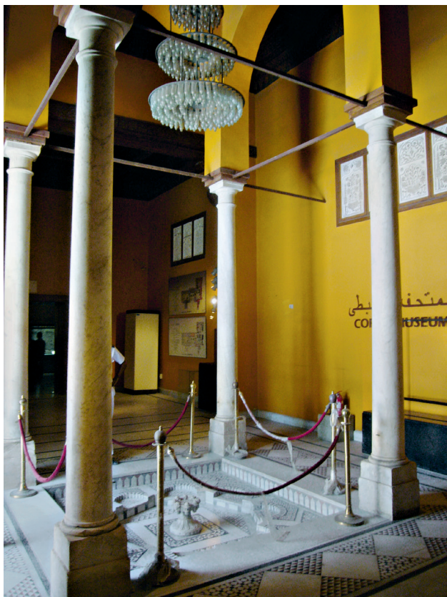
Fig. 12. Fasqiyya de la salle 25 du Musée copte.