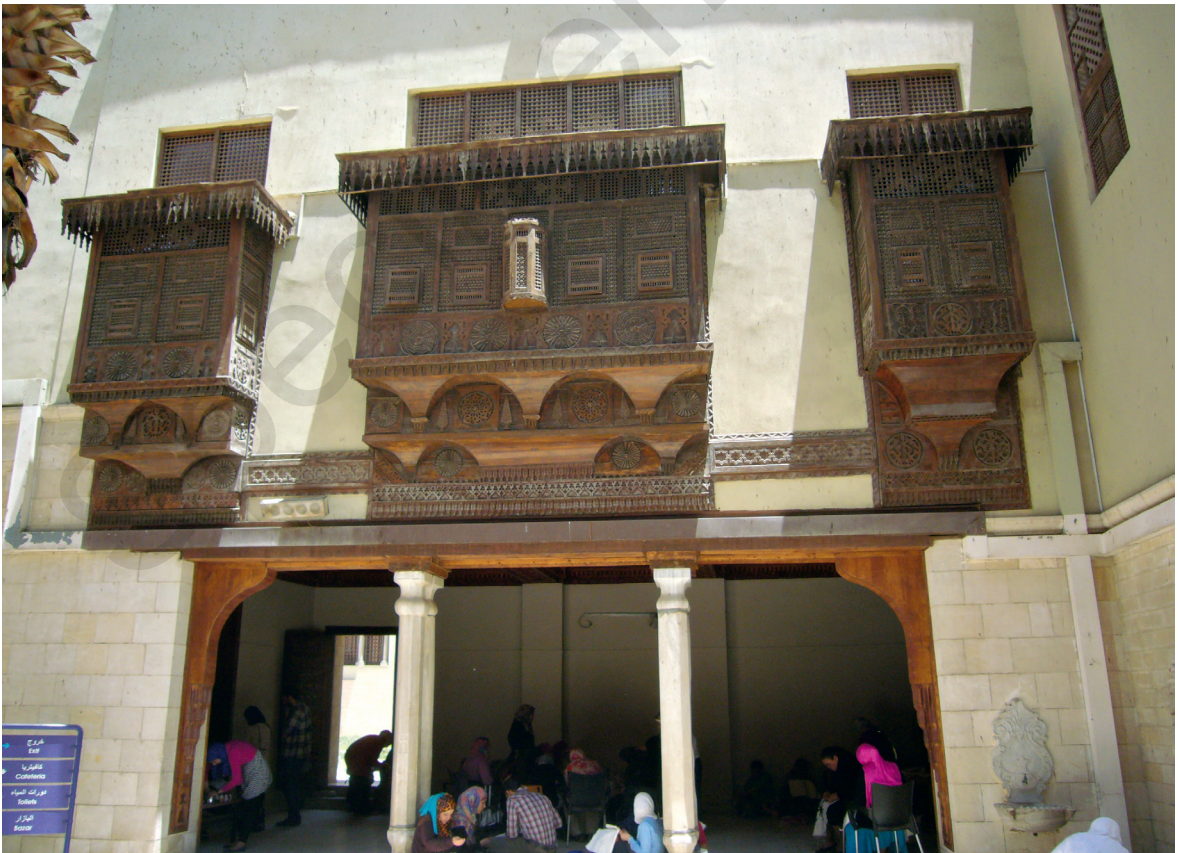
Fig. 18. Moucharabieh de la salle Mounira du Musée copte (vue extérieure).