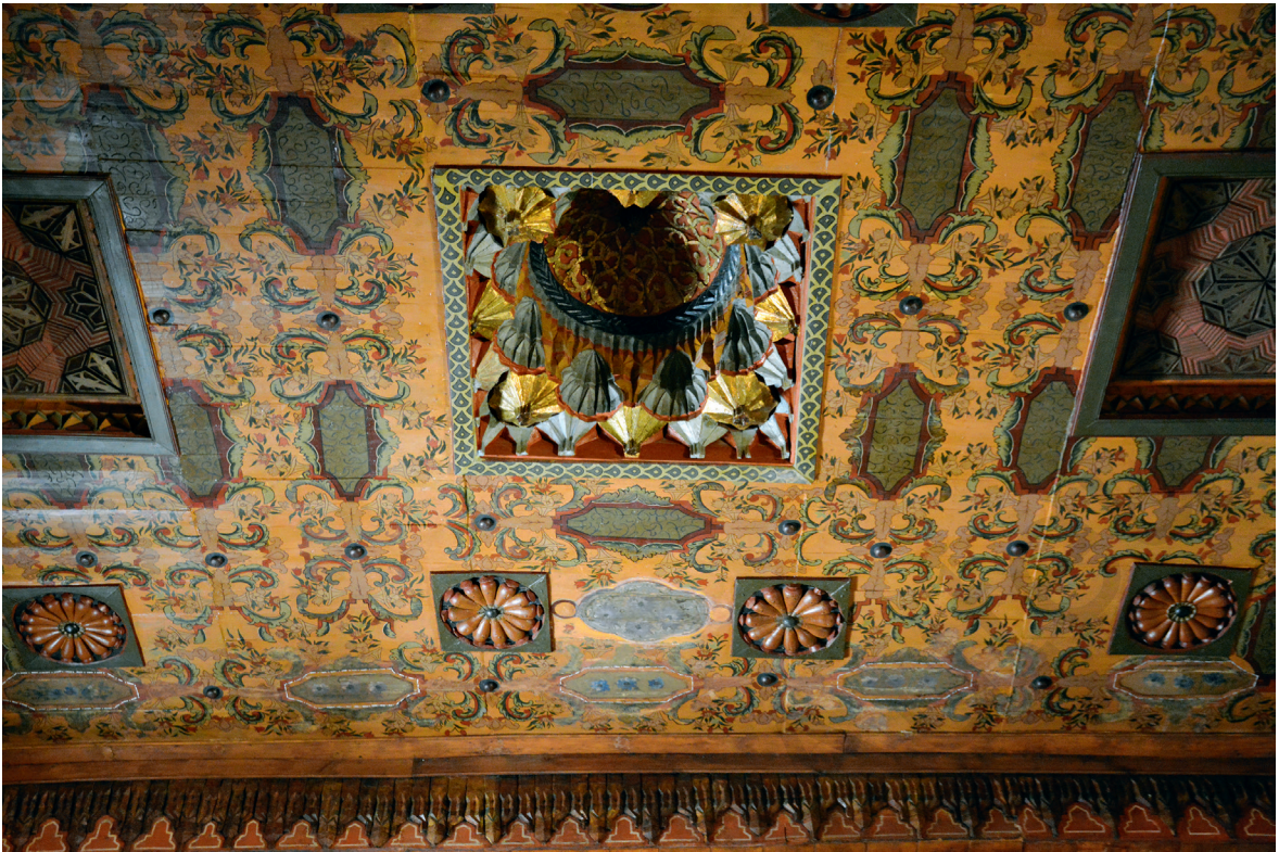
Fig. 17. Plafond de la salle Mounira (détail), XVIII e siècle, Musée copte.