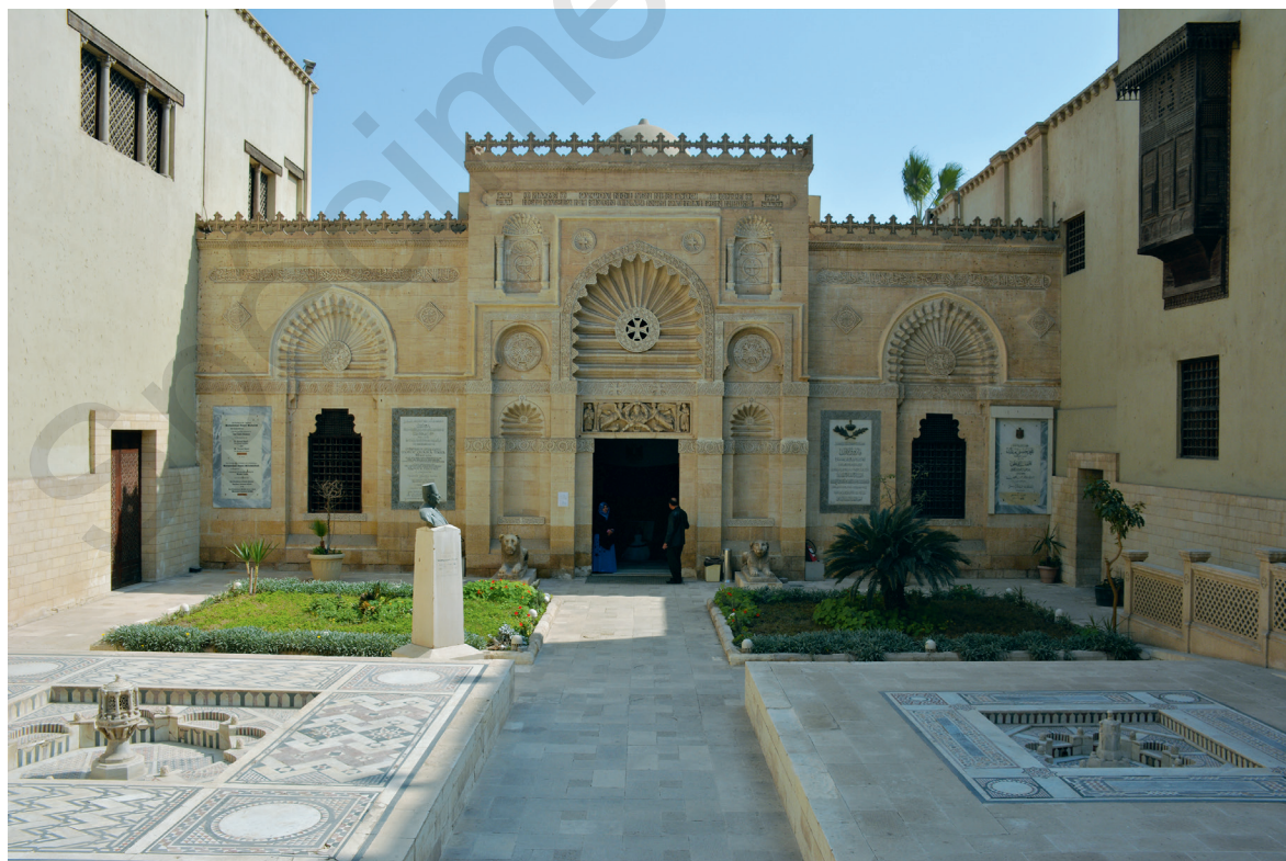
Fig. 4. Façade néo-fatimide du Musée copte.