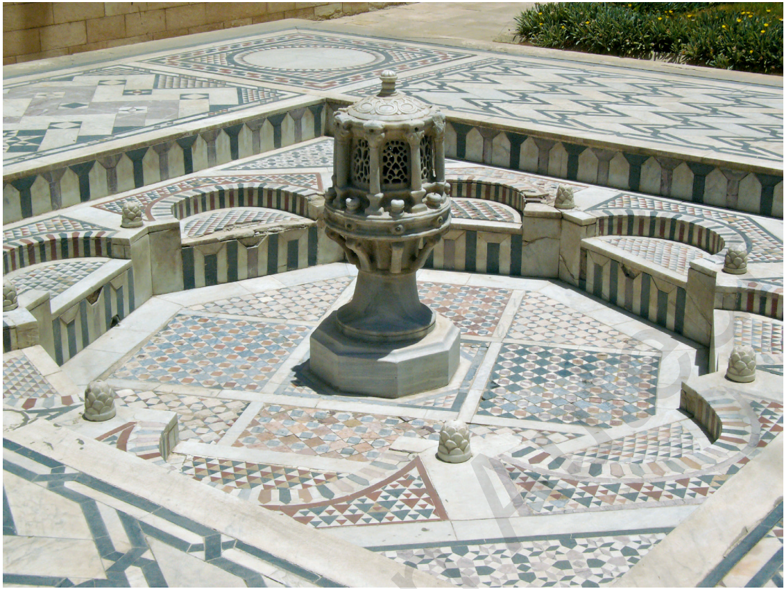
Fig. 10. Fasqiyya de la cour devant la façade néo-fatimide du Musée copte.