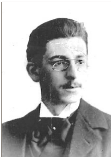
José Enrique Rodó

funde y las cosas de nuestro inmediato pasado vuelven como remotas o ajenas para nosotros” ( Motivos , 70), como si ese acontecimiento mesiánico nos liberase, o nos redimiera, de las rutinas vitales y gnoseológicas. Procreando una nueva época, este acontecimiento libera a las mayorías del statu quo ; iniciando una