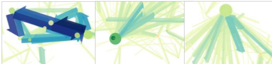
FIGURE 1. Dispositions et gestion des superpositions

Le dessin des différentes couches et de leurs objets est finement paramétrable, afin de tenir compte de l'éventuelle complexité de l'information, en termes de densité, nécessitant une gestion particulière des superpositions et des dispositions des liens et nœuds (voir Fig. 1). Les liens les plus gros sont placés au premier plan par défaut à l'inverse des cercles les plus larges