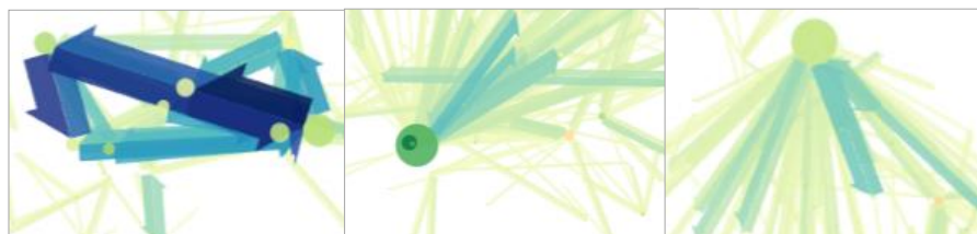
FIGURE 1. Dispositions et gestion des superpositions

Le dessin des différentes couches et de leurs objets est finement paramétrable, afin de tenir compte de l'éventuelle complexité de l'information, en termes de densité, nécessitant une gestion particulière des superpositions et des dispositions des liens et nœuds (voir Fig. 1). Les liens les plus gros sont placés au premier plan par défaut à l'inverse des cercles les plus larges