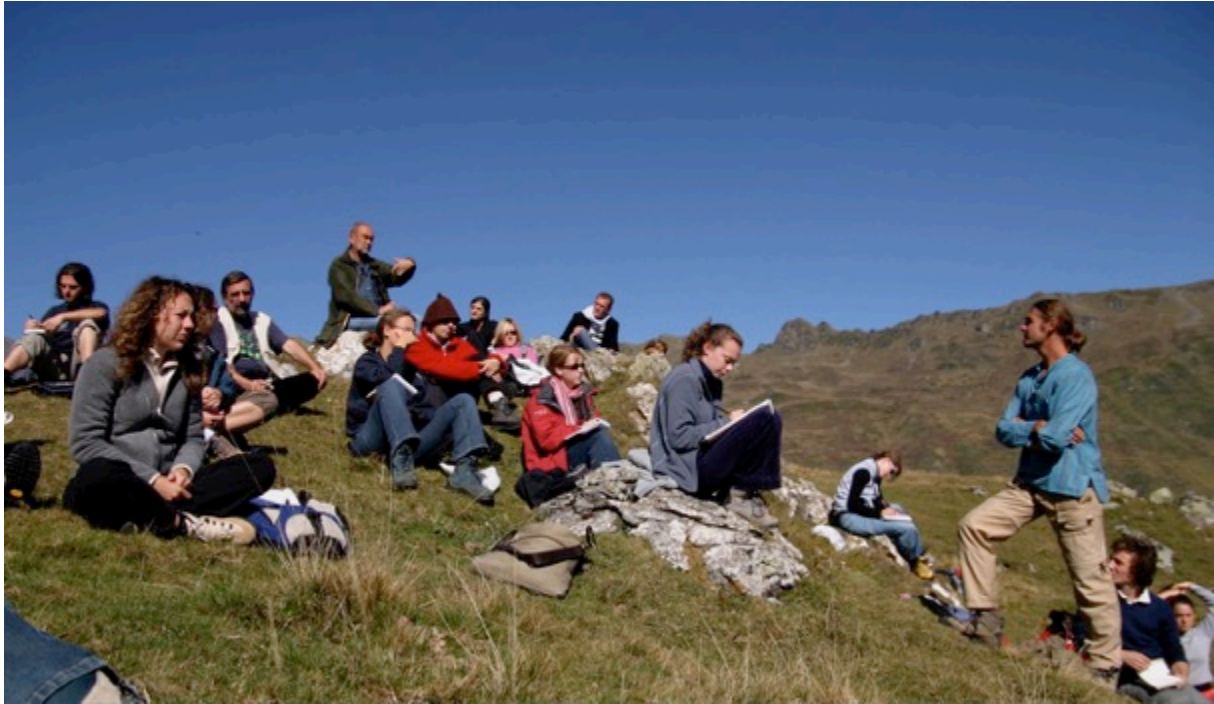
Figure 2 : Voyage dans les Pyrénées. Plateau de Saugé. Septembre 2005

Il convient enfin d'insister sur le fait que l'approche historique est au cœur de la démarche didactique proposée par la formation des paysagistes de l'EnsapBx. Les paysages sont en effet considérés comme des systèmes en mouvement qu'il s'agit de replacer au sein de durées socio-écologiques discordantes et, en même temps, parfaitement tressées. Il s'agit pour l'étudiant « de recomposer un récit paysager, ou au moins à en reconstituer certains épisodes, dont la connaissance est essentielle à la compréhension des enjeux du projet à concevoir. Cette pratique permet ainsi de resituer le paysage sur un axe du temps prolongé au-delà du présent, dans l'espace où se déploie ce projet qui ne serait que bricolage des apparences, s'il n'était inspiré par une compréhension du processus dynamique dans lequel tout paysage est inscrit 11 ». Dans cette perspective, le mémoire personnel dit « Cent ans de paysage », consistant à analyser à différentes échelles de temps l'évolution et la dynamique d'un paysage, est très vite devenu un des exercices emblématiques de la formation.