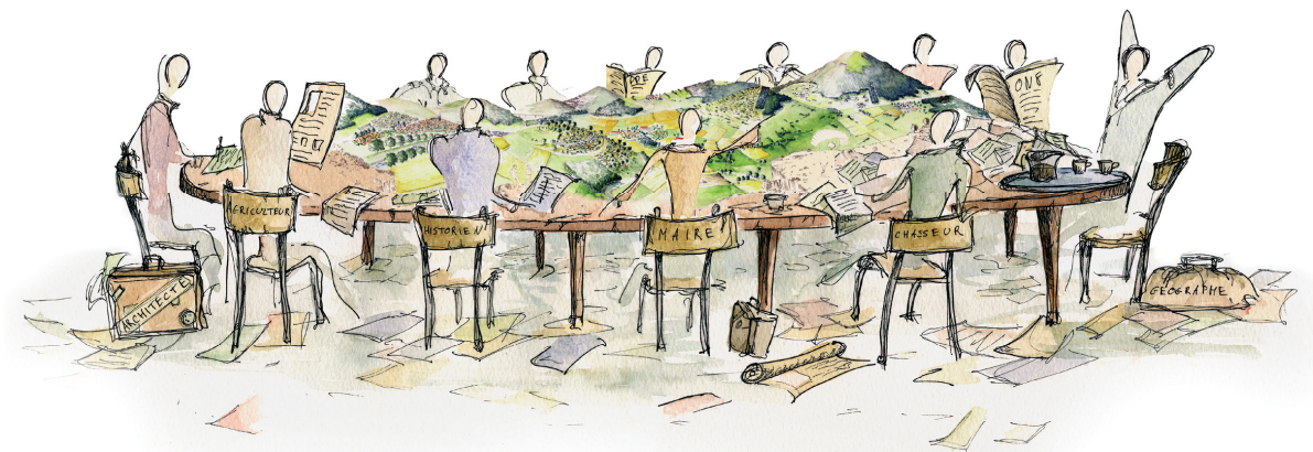
Figure 1 : Au centre du projet pédagogique de Bordeaux, le paysage comme objet de médiation. Illustration de Hubert Mansotte, extraite de EnsapBx-CEPAGE, 2004, Enseigner le paysage. Le projet pédagogique de la formation des paysagistes dplg de Bordeaux, Talence, p.22.

Une fois le corps pédagogique constitué, il s'agit désormais de construire un programme des études. Les enseignants fondent cette entreprise sur la base d'une importante réflexion critique relative aux enjeux contemporains du paysage et au rôle social actuel et futur de la profession de paysagiste. Le paysage défendu par l'équipe pédagogique est un paysage qui doit être tenu à distance de certaines approches qui supposent une contradiction fondamentale entre son appréhension esthético-sensible et tout effort de construction d'une connaissance scientifiquement fondée. Le paysage est ici entendu comme un cadre intégrateur de pensée et d'action à la croisée de la société et de l'environnement capable de rendre compte de la complexité et de la dynamique des systèmes socio-environnementaux et territoriaux. Ce faisant, le paysage devient un outil permettant de penser les nécessaires interrelations entre les politiques de protection patrimoniale, de gestion des environnements et de développement des territoires. Dans cette perspective, « la démarche paysagiste s'apparente, de plus en plus, à celle d'un médiateur, capable de rassembler les éléments d'une connaissance des paysages, d'en faire comprendre les formes et les dynamiques, de concevoir des représentations et de formuler des propositions aptes à fonder une approche concertée de la valeur de ces paysages et de l'avenir des territoires 7 ».