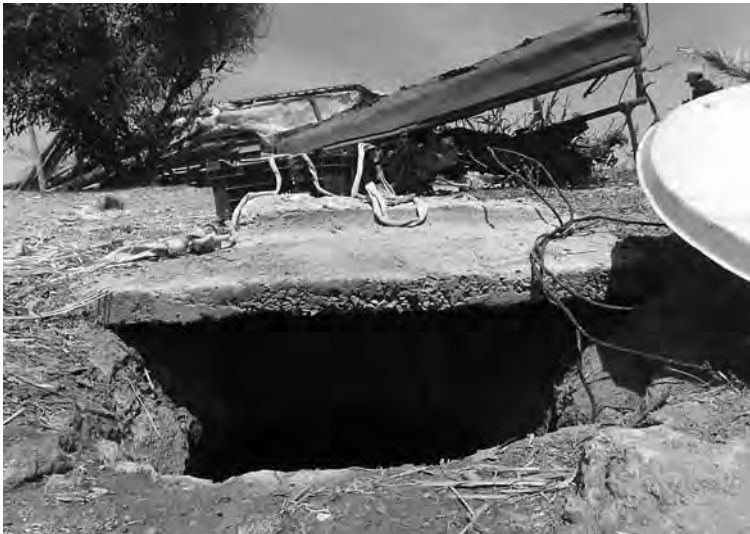
Fig. 7 - La citerne souterraine.

D'après le rapport de J. Coco, les deux parties de la fabrique sont séparées par un grand mur, oblique par rapport à la rangée de cuves occidentale, se terminant par une courbe. Entre ce mur et la rangée ouest des cuves, une construction de forme circulaire présentant en surface un radier en galets a été découverte vers le nord; son fond, situé à 0,70 m de profondeur, est constitué d'une couche de béton compacte. Cette structure, nommée « puits » dans le rapport de J. Coco (Fig. 4), n'est pas visible aujourd'hui sur le terrain; sa fonction ne peut être encore précisée.