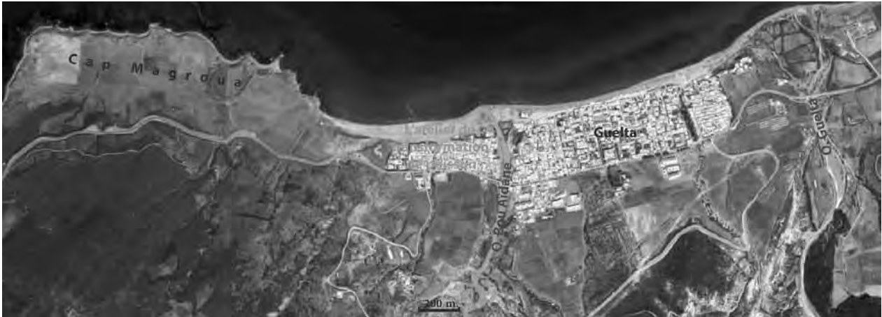
Fig. 2 - Localisation de l'atelier de transformation du poisson de Guelta.

Si le secteur est aujourd'hui urbanisé et occupé par le village moderne, l'atelier devait dans l'Antiquité appartenir au monde rural ; il est impossible de déterminer s'il faisait partie d'une implantation plus étendue comme une villa rurale.