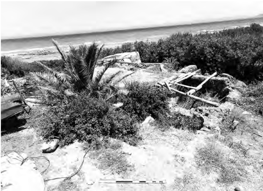
Fig. 3 - Vue générale des vestiges