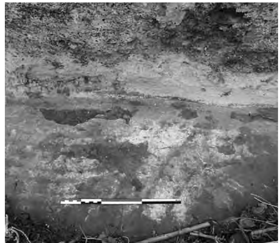
Fig. 6 - Fond de la cuve E.

Les dimensions des cuves sont plus ou moins égales (en moyenne 2,40 x 2,15 x 1,40 m), ce qui permet d'estimer un volume de 65 m 3 . Seules les cuves E et F sont aujourd'hui accessibles, les autres ont été remblayées ou remployées à divers usages utilitaires par la famille occupant une maison à quelques mètres à l'ouest. Une citerne souterraine de 20 m 3 est sise juste à l'ouest de la rangée de cuves occidentale (Fig. 7).