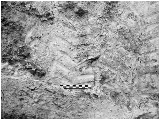
Fig. 5 - Détail de la paroi occidentale de la cuve E.

La partie orientale est formée d'un ensemble de neuf cuves (A-I) de forme rectangulaire aux angles arrondis disposées sur trois côtés (sud, est et ouest) autour d'une plateforme rectangulaire d'une superficie d'environ 18,5 m 2 . Les cuves comme la plateforme qui les surplombe étaient recouvertes d'un épais mortier de tuileau. Les cuves sont construites en moellons liés par un mortier de chaux très compact. Le mortier de tuileau sur les parois internes des cuves est très compact, de couleur blanche ; il contient quelques cailloutis. La surface est lissée et présente par endroits des traces d'outil disposées en forme d'épis sans doute pour faciliter l'emprise de la couche supérieure (Fig. 5). Le sol des cuves avait été également imperméabilisé à l'aide d'un mortier de tuileau (Fig. 6).