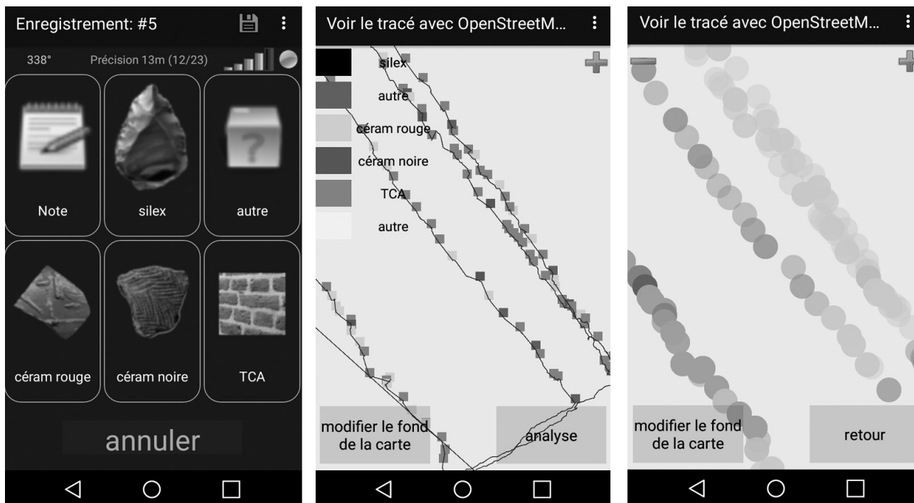
Fig. 1. Interface de l'application Archeotracker : boutons personnalisables, carte de localisation des traces et artefacts, carte de densité.

sur les espaces, le peuplement et les réseaux anciens de la Garonne –, financé par le SRA Occitanie et l'UMR 5608 TRACES, et placé sous la responsabilité de Nicolas Poirier 1 . Il vise à étudier les processus d'anthropisation du lit majeur et des premières terrasses du fleuve, et repose entre autres sur des campagnes de prospection systématique. Les exemples utilisés dans cet article proviennent de ces campagnes.