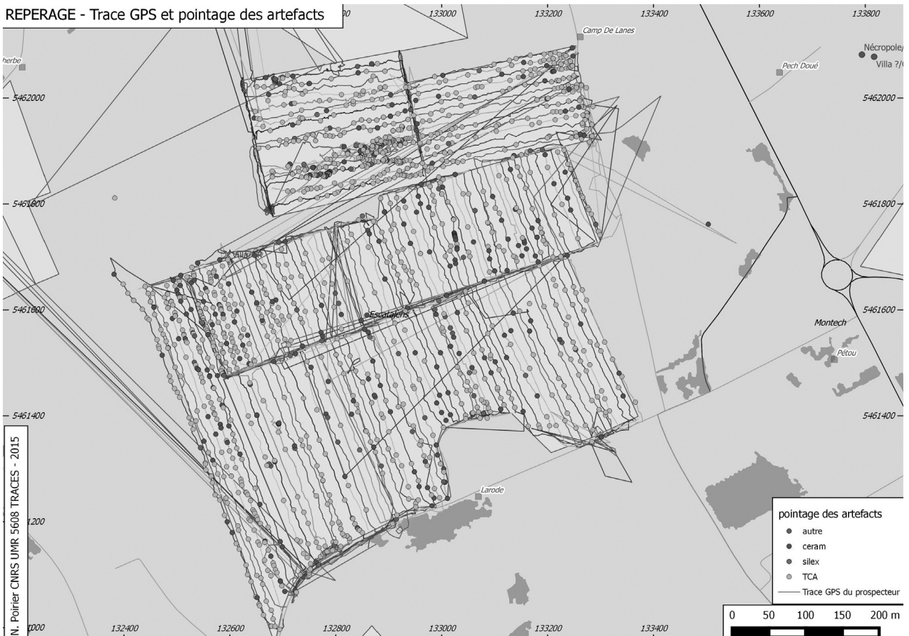
Fig. 2. Traces Gps des prospecteurs et cartographie thématique des artefacts sous Sig.

possible d'ajouter une note écrite pour commenter tel ou tel objet. Quand la ligne de prospection est achevée, l'enregistrement est suspendu pour reprendre à la ligne suivante. Lorsqu'un site est découvert, il est évidemment possible de créer un fichier-trace spécifique avec un code d'enregistrement propre. Quelle que soit la méthode mise en œuvre, l'ensemble des objets attachés au site peut être référencé et chaque prospecteur peut observer en direct la répartition spatiale de ses découvertes pour visualiser les lieux où il est déjà passé dans le cadre d'une recherche aléatoire. L'outil peut également servir à rectifier une trajectoire quand les écartements entre prospecteurs sont importants. Une fois la prospection du site achevée, il est possible de revenir sur le fichier de zone de prospection et de reprendre sa ligne au point où elle avait été laissée.