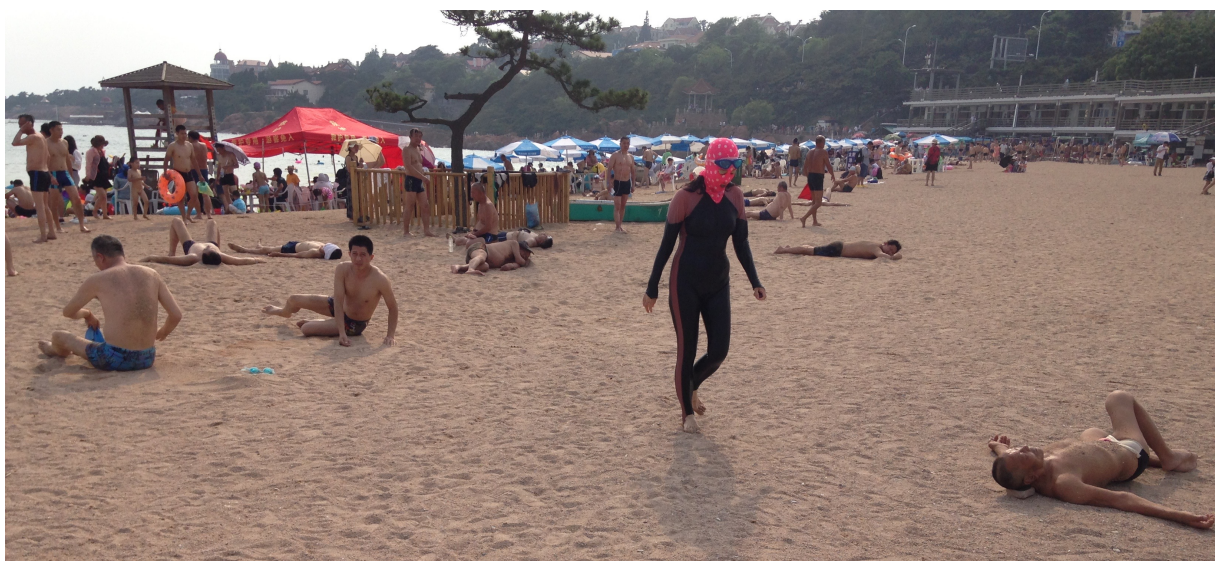
Figure 4 - Le facekini à Qingdao, une pratique genrée

Photo de Benjamin Taunay (juillet 2015).