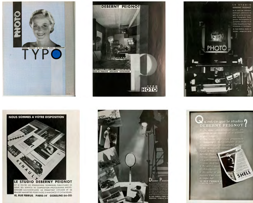
› Annonces pour les Fonderies Deberny et Peignot 1930-1932.