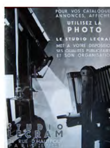
› Annonces pour l'imprimeur Lecram.

Damour et Dorland Paris, qui représentent plus de 80 % des annonces classées « Publicité » dans Vendre , révèle que la pratique de la photographie n'est jamais un argument central dans leurs méta-publicités, à l'exception d'un cas sur 200.