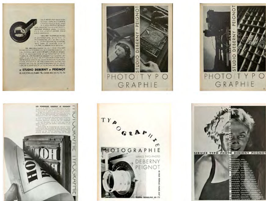
➤ Annonces pour les Fonderies Deberny et Peignot 1929-1930.