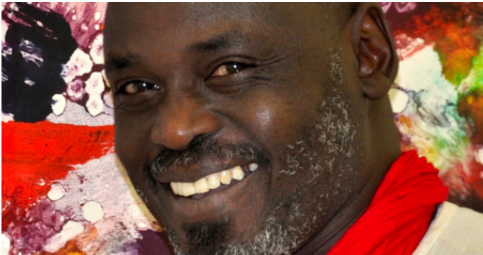
Abdelaziz Baraka Sakin