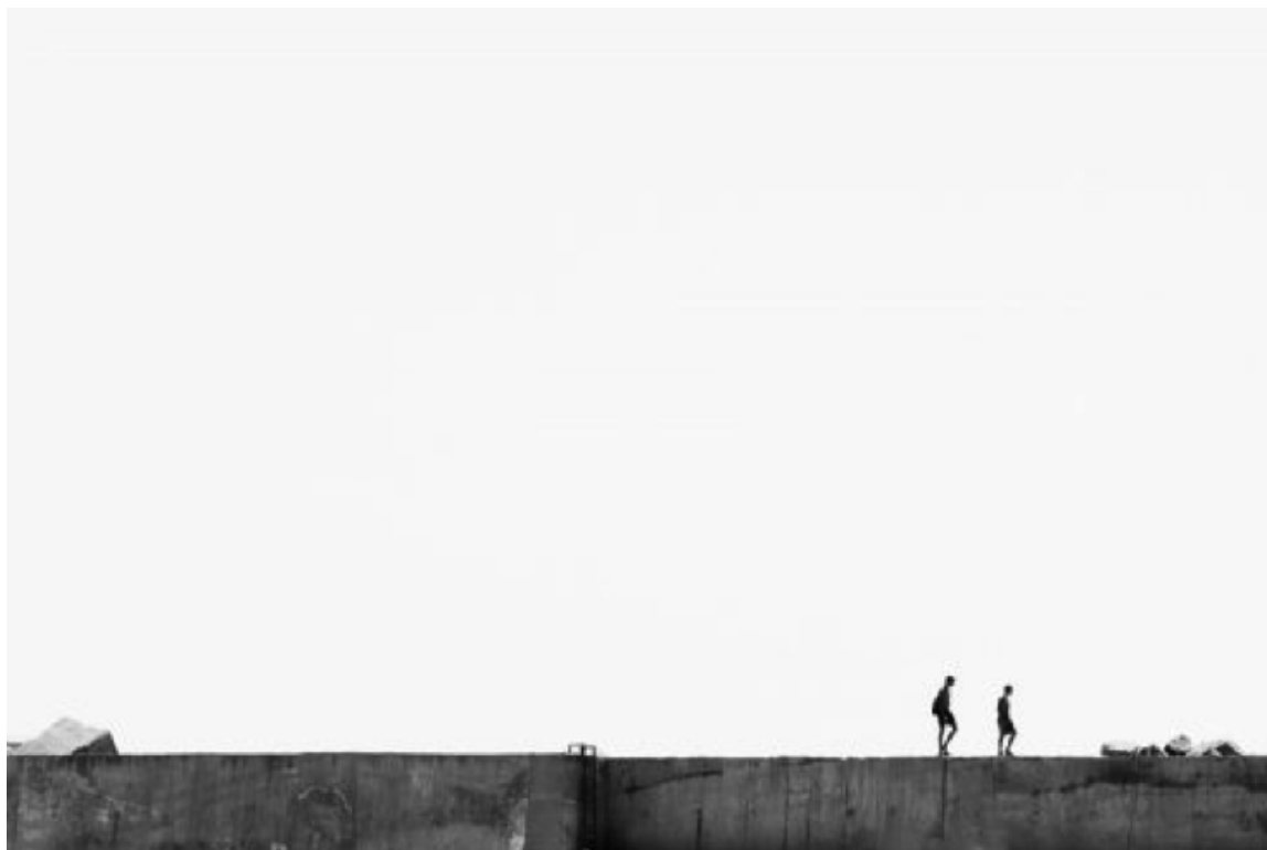
Rym Khene, Détours , Alger

Une troisième voie empruntée par l'imagination pour penser le politique est la contemplation de l'« espace de turbulences » (p. 314) de l'histoire et de ses résonances avec l'intime, potentiellement révolutionnaires. Les photographies de Rym Khene interrogent cette grâce de l'instant volé, l'envol d'une nuée d'oiseaux, le tracé sinueux d'une route jusqu'à l'horizon, la texture de pierres en ruines.