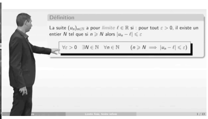
Figure 2c : cours en ligne ( L1, exo7 )