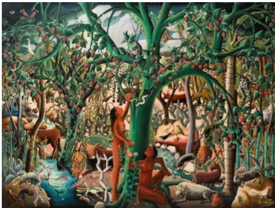
W. Bigaud, Paradis primitif