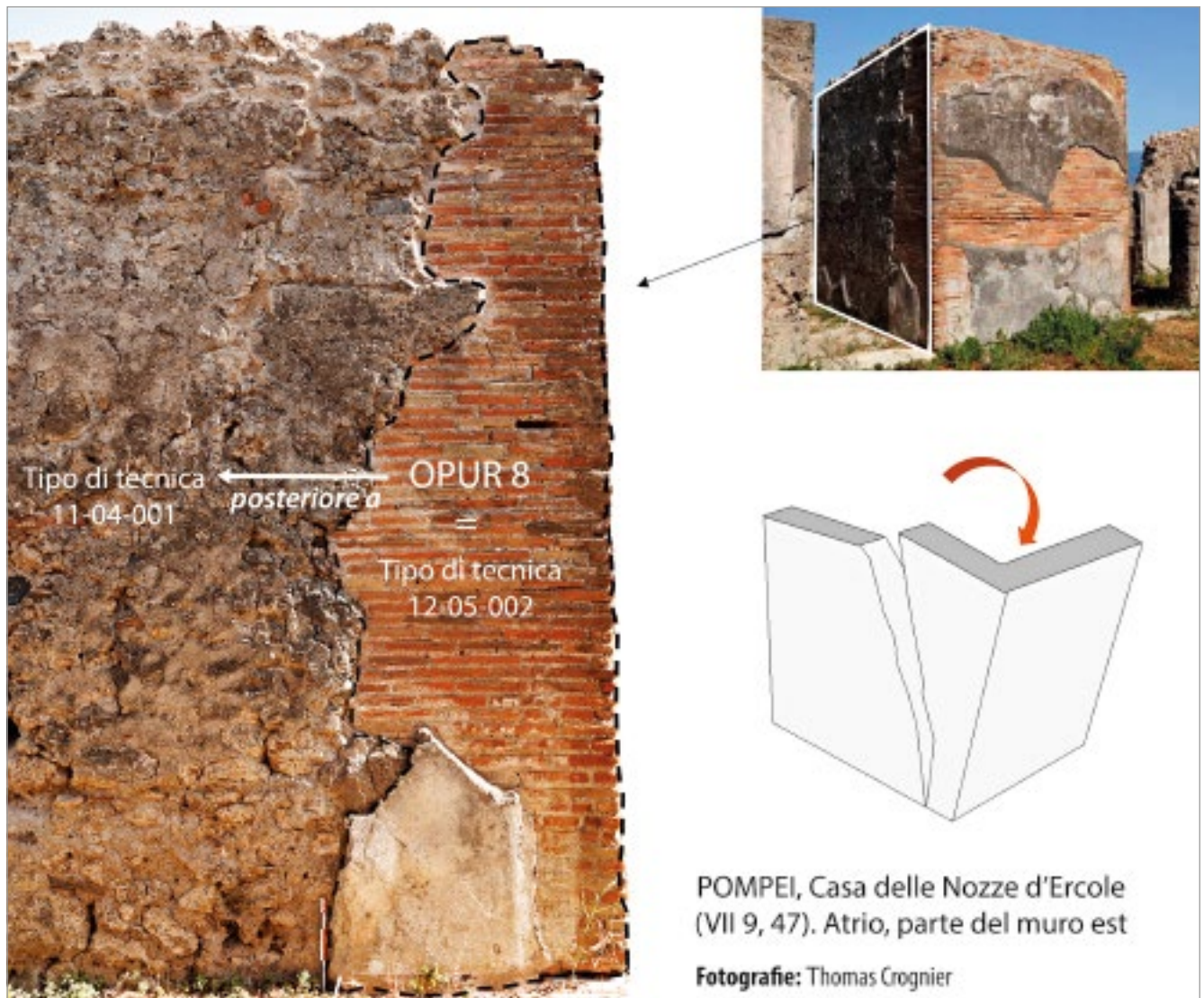
fig. 2 – Esempio di identificazione OPUR: rifacimento di seguito al ribaltamento del cantonale.

bancadati è stata associata a un GIS sviluppato da Julien Cavero, basato sulle piante gentilmente fornite dal Parco archeologico di Pompei 16 . D'ora in poi, nella sua versione definitiva, il database OPUR presenta per ciascuna riparazione un sistema di indicizzazione e di analisi organizzato secondo la tab. 1 .