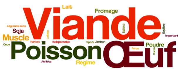
Figure 1 : Représentation du nuage de réponses issues du test d'association « Si je vous dis 'protéines', quels sont les premiers mots qui vous viennent à l'esprit ? ». La taille de chaque verbatim est proportionnelle à sa fréquence d'occurrence.

Quelques résultats marquants sont ici résumés. L'étude des associations de mots spontanément donnés à partir du mot « protéine » suggère que ce concept repose essentiellement sur des aliments carnés. Ainsi à la question « Si je vous dis 'protéines', quels sont les premiers mots qui vous viennent à l'esprit ? », la réponse viande-poisson-œuf est celle qui est majoritairement proposée par l'ensemble des participantes (Figure 1).