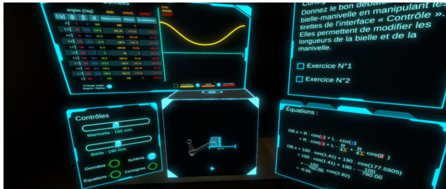
Figure 3 : Interface de l'application réalité virtuelle du système Bielle manivelle

Les participants à cette première expérimentation (N = 61 ; 7 femmes, 54 hommes) étaient tous étudiants du campus d'Angers. Ils parlaient le français couramment, garantissant ainsi une bonne compréhension des explications fournies.