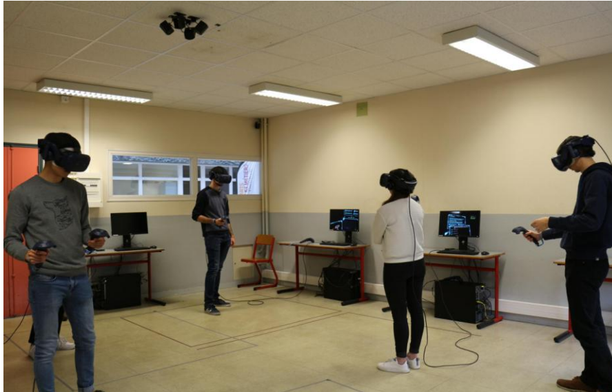
Figure 2 : Étudiants 1 ère année pendant une séance de cours en réalité virtuelle au campus d'Angers

du fonctionnement des deux systèmes modélisés. Sur ce second point, les objectifs pédagogiques visés sont de permettre aux apprenants d'appréhender la cinématique des mécanismes proposés et d'identifier l'implication des différents paramètres des mécanismes sur leur cinématique. Dans ce but, l'application propose des exercices à résoudre - par la manipulation - de ces systèmes.