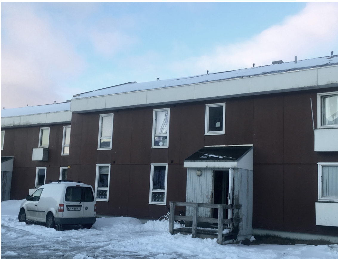
13 et 14. « Saqqaa », à Nuussuaq, parfois appelé par les habitant·e·s « Nuuk Ghetto » car c'est un lieu connu de vente et de consommation d'alcools et de drogues, mais aussi un quartier de logements sociaux. La famille qui occupe l'appartement attribué par l'administration des dortoirs paye pourtant le même loyer que les étudiant·e·s logé·e·s en résidence spécifique (Duc, 2018).