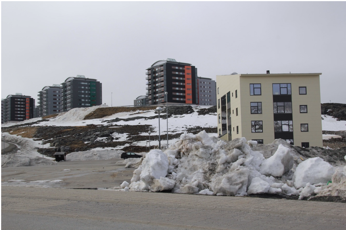
8. Nouveaux logements à Qinngorput. Quartier le plus récent de Nuuk, dont la construction a commencé au début des années 2000. À droite, l'un des blocs de l'îlot de résidences étudiantes de Unaaq. La construction de résidences étudiantes suit le développement des nouvelles zones à lotir (Duc, 2018).

croissance urbaine ne se doublant pas de constructions suffisantes, les habitant·e·s comme les acteurs publics parlent à Nuuk d'une « pénurie de logements » : Asii Chemnitz Narup, la maire actuelle de la municipalité de Sermersooq en ayant fait un élément central du programme de son premier mandat (2013-2017). Au-delà d'un fort déséquilibre entre demande et disponibilité, le marché du logement repose en grande partie sur des investissements publics ainsi que sur un fonctionnement s'appuyant sur la proximité entre les employeurs publics (Naalakersuisut, municipalités et entreprises publiques) et les gestionnaires publics (Ini et Iserit). Si elles assurent théoriquement un logement à tout·e employé·e du secteur public, ces modalités de fonctionnement et d'attribution des logements sont souvent décrits comme manquant de transparence et de participation des populations locales dans la production urbaine, sans parvenir par ailleurs à limiter les loyers élevés (Hansen, Bitsch et Zalkind, 2013 ; Sørensen et Willumsen, 2013).