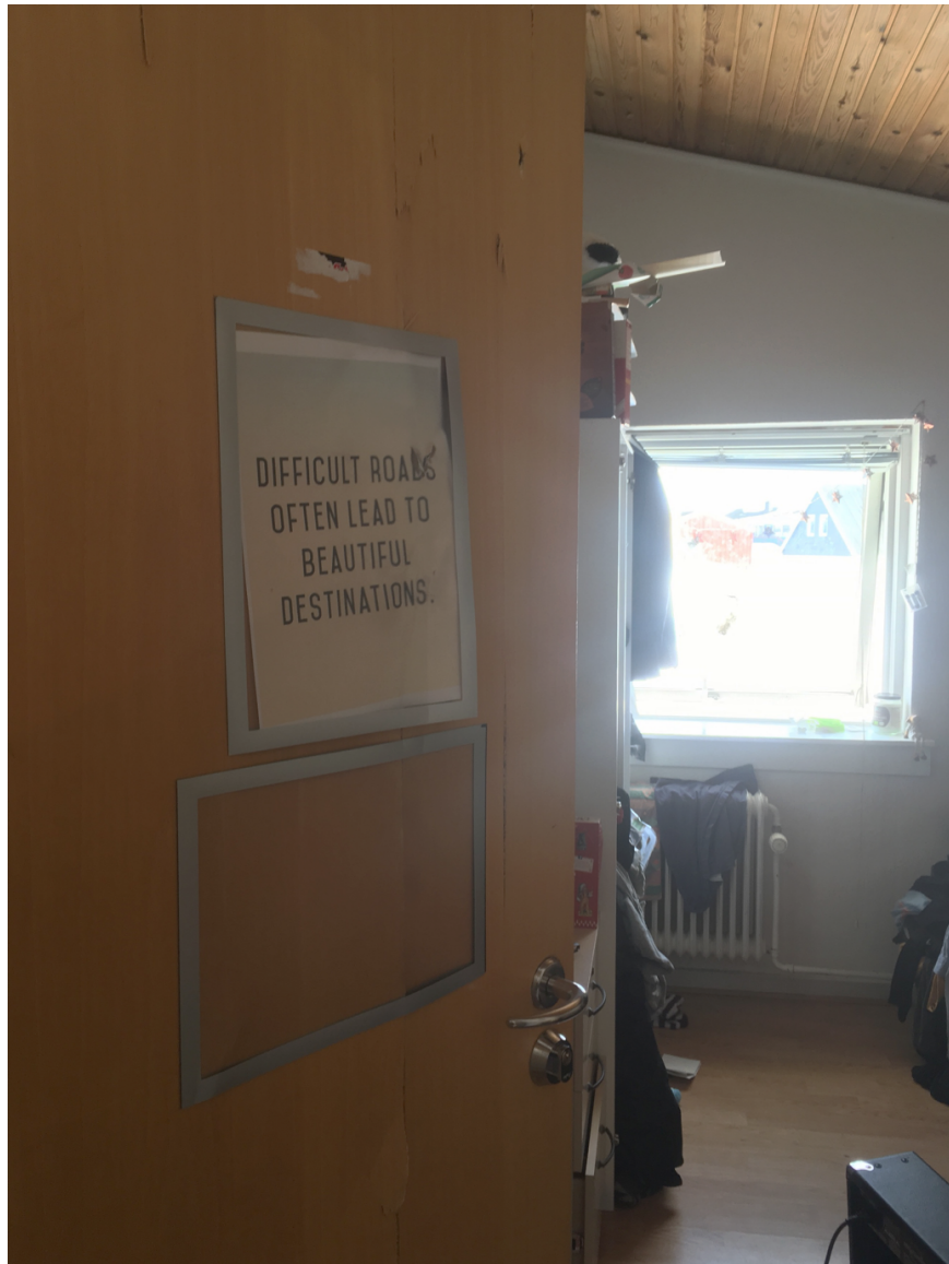
15. Les portes des chambres individuelles des lycéen·ne·s sont des scènes d'appropriation temporaire de l'espace domestique (Duc, 2018).

Parmi les étudiant·e·s enquêté·e·s, les stratégies pour parvenir à se loger reposent essentiellement sur la mobilisation des réseaux sociaux (famille, ami·e·s), à travers deux types de démarches : pour partager un logement, ou pour déclarer une autre résidence. Déclarer un statut résidentiel en dehors de Nuuk, voire du Groenland permet en effet d'être considéré·e comme étudiant·e « extérieur·e » et de faire une demande auprès de KAF. Le gestionnaire est alors en situation d'obligation de fournir un logement, même s'il existe un flou juridique sur la question : si les textes font de l'accès à un logement un droit soumis à des priorités d'attribution (Inatsisartut, 2007), le site de conseil en orientation Sunngu stipule pourtant que KAF n'a aucune responsabilité devant les étudiant·e·s qui viennent à Nuuk sans logement. Il s'agit alors de jouer avec les catégories d'ayant-droits, plutôt que de réellement contourner les réglementations. Si le système est présenté comme un moyen d'offrir des chances égales peu importe le lieu d'origine des étudiant·e·s (Naalakarsuisut, 2018), ces modes de gestion et la forte demande ne sont pas sans effets sur son fonctionnement. Les étudiant·e·s les plus fragiles économiquement (qui sont dépendant·e·s du système public), ainsi que celles et ceux ne pouvant pas mobiliser leurs réseaux sociaux comme ressource sont malgré tout défavorisé·e·s, dans leurs capacités différenciées à faire face aux tensions existantes dans l'accès au logement étudiant.