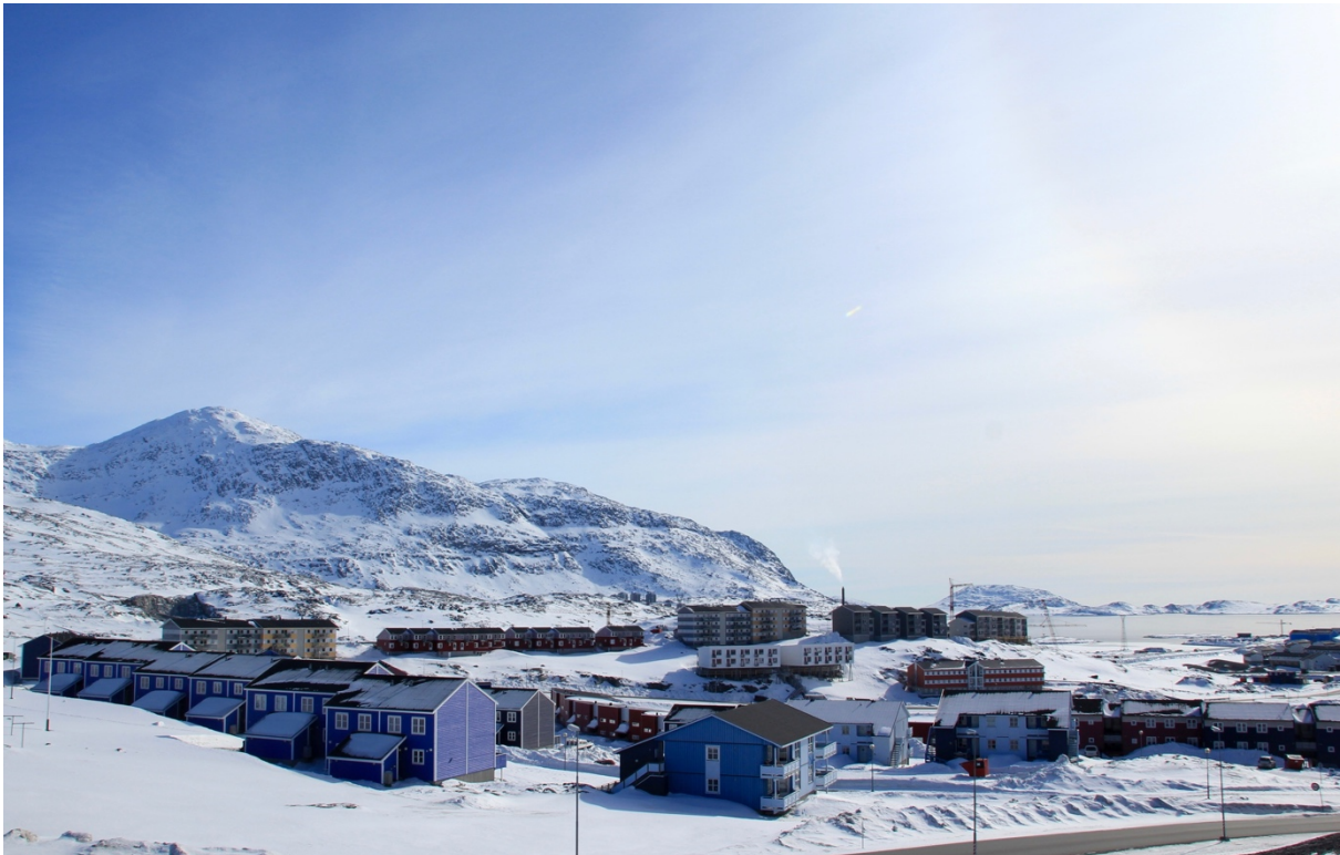
Illustration de couverture : Le quartier de Nussuaq depuis l'université. Les premières constructions sortent de terre dans les années 1970. Les grues à l'horizon sont un signe parmi d'autres de la croissance économique et démographique à Nuuk (Duc, 2018).

Pour citer cet article : Duc M., 2019, « Vu / Portfolio : (Se) loger et étudier à Nuuk », Urbanités , mai 2019, en ligne.