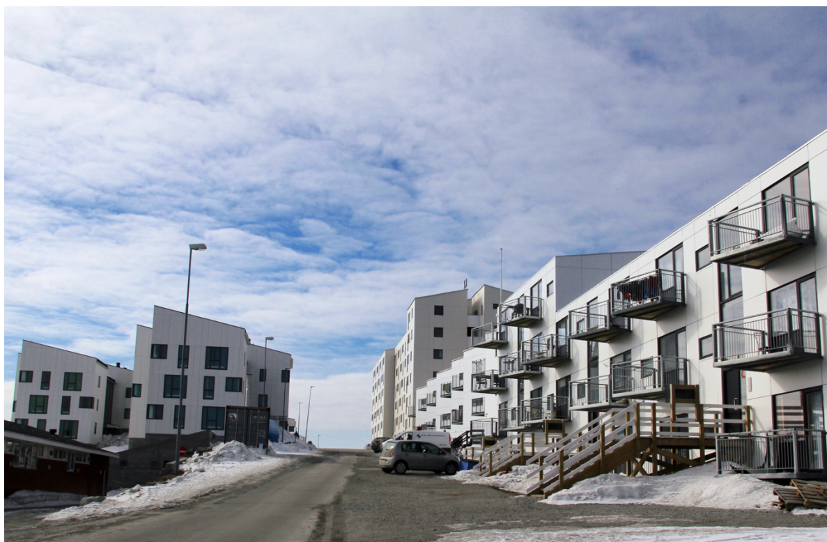
6. Kujaalerpaat. Sur la droite, des logements principalement destinés aux étudiant.e.s et à leurs familles. On croise parfois dans les halls d'entrée poussettes et luges. La résidence est principalement composée d'appartements trois pièces (Duc, 2018).