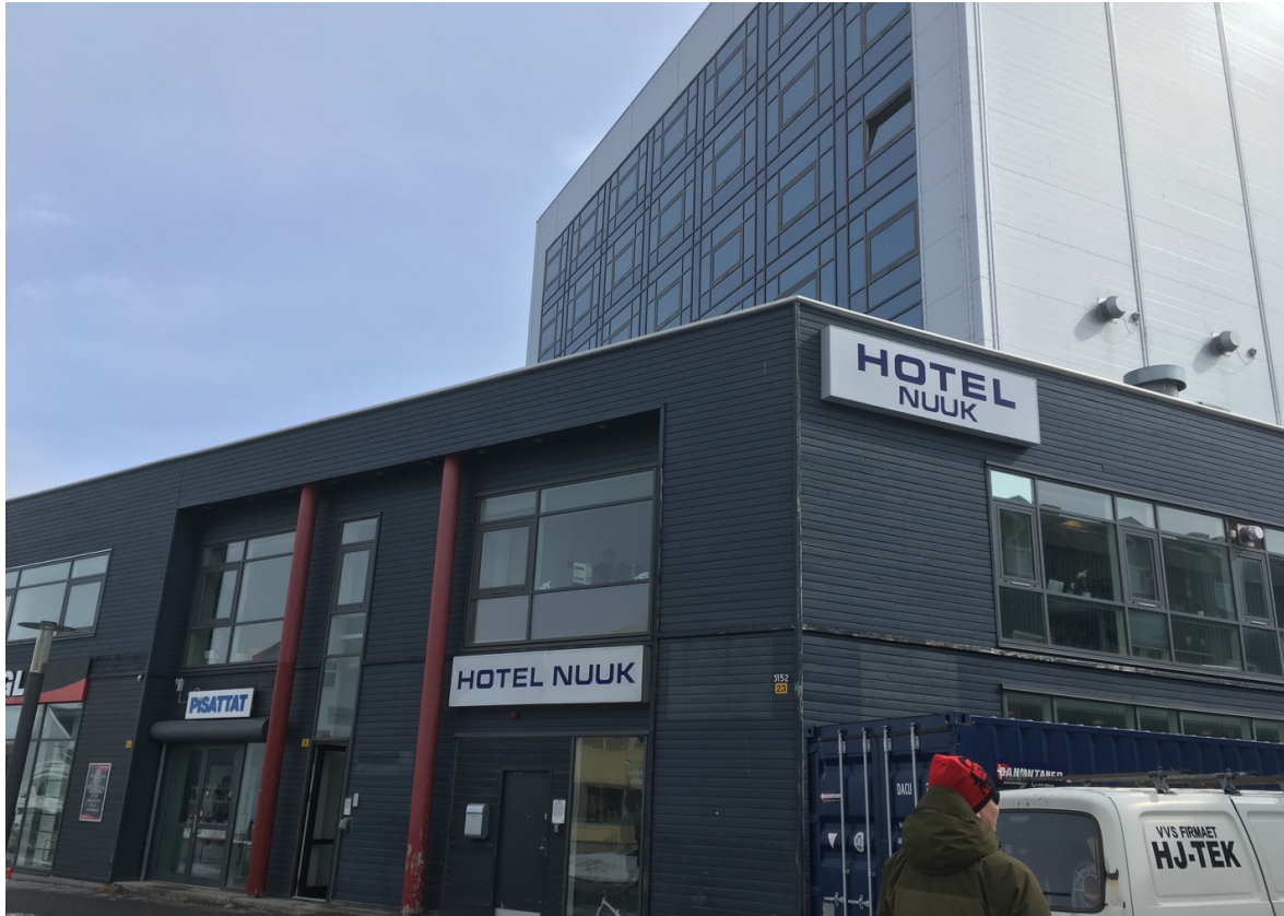
10. Hotel Nuuk, sur Imaneq – la rue piétonne de Nuuk. Géré désormais par l'administration des dortoirs (KAF), l'hôtel a été transformé en résidence étudiante à la fin des années 2000, mais a gardé ses enseignes (Duc, 2018).