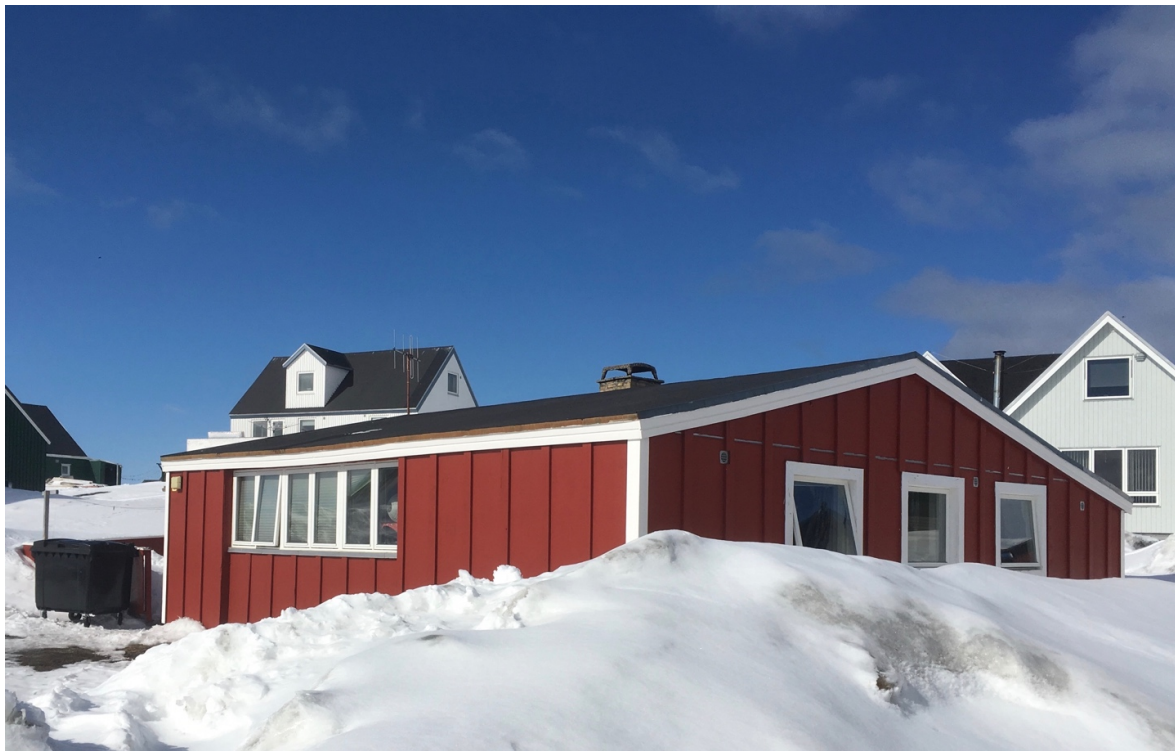
11. Avec l'augmentation du nombre d'élèves scolarisés dans le secondaire supérieur, l'administration du lycée a acquis de nouveaux logements sur le marché « régulier » pour les transformer en résidence étudiante. L'acquisition de ces logements, autrefois résidences familiales et leur mise à disposition pour les étudiant·e·s vient alors rompre avec la logique de résidence universitaire (Duc, 2018).