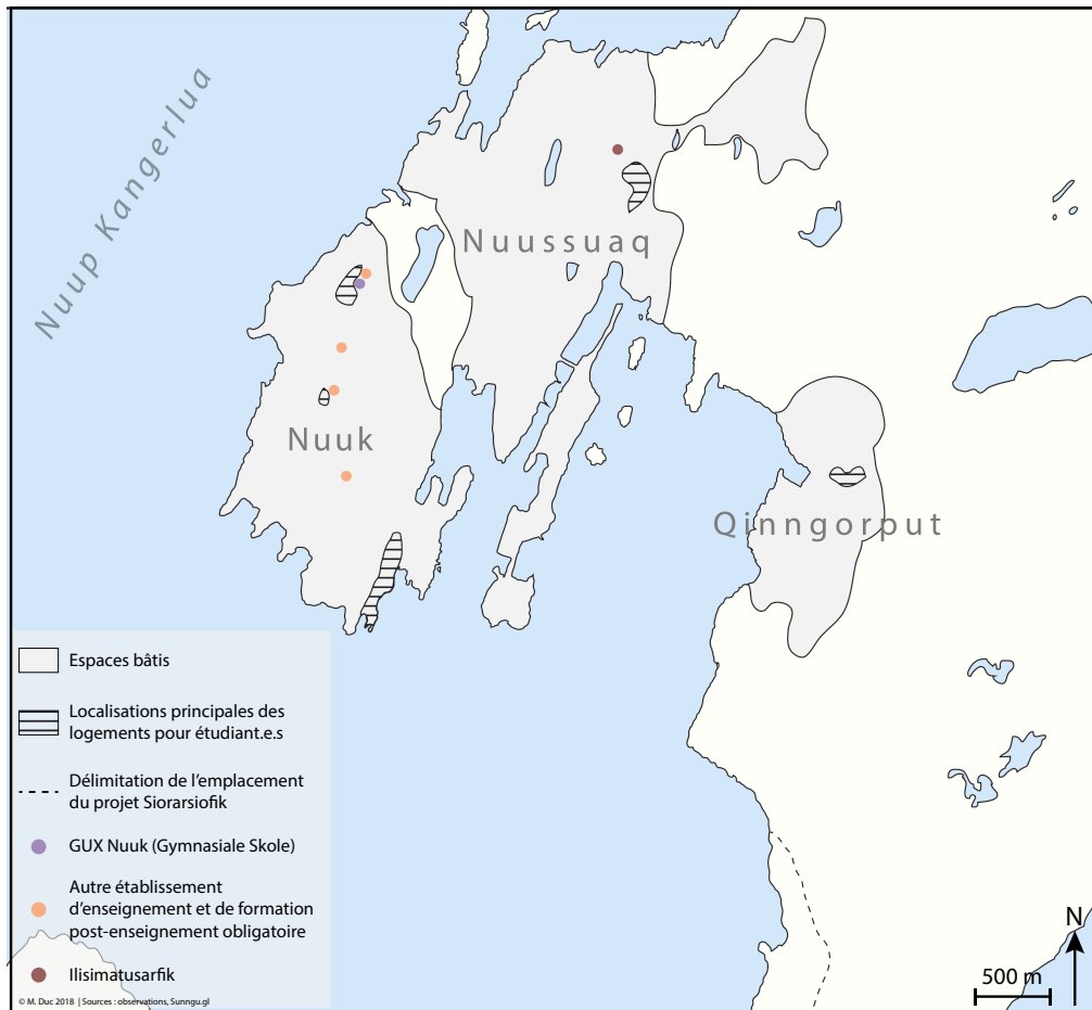
1. Carte de localisation des quartiers et établissements mentionnés (Duc, 2018)