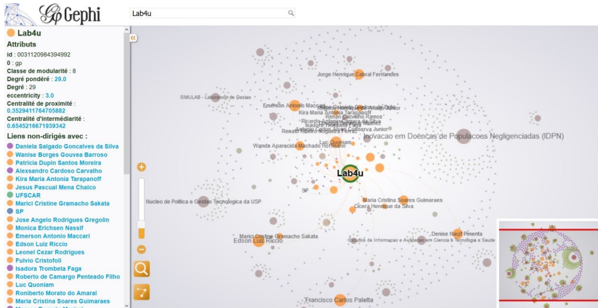
Figure 1 : exemple de réseau réalisé à partir du logiciel Gephi (recherche académique au Brésil à retrouver sur http://vlab4u.info/ )