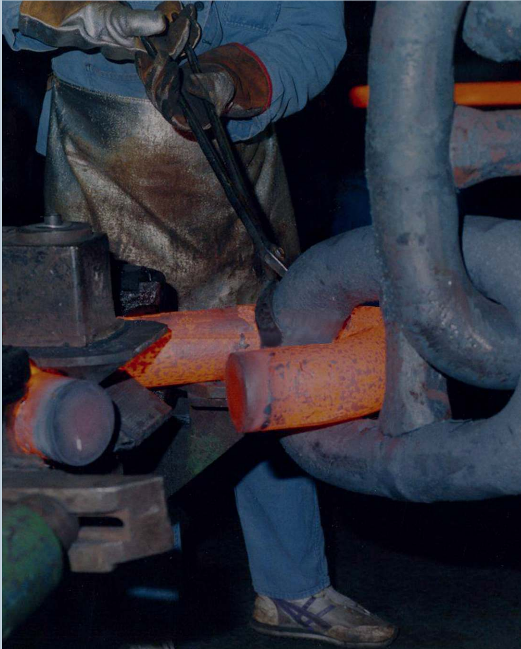
3. Chaîne de mouillage en cours de fabrication La chaîne n'est pas chose facile à élaborer ni à manipuler.