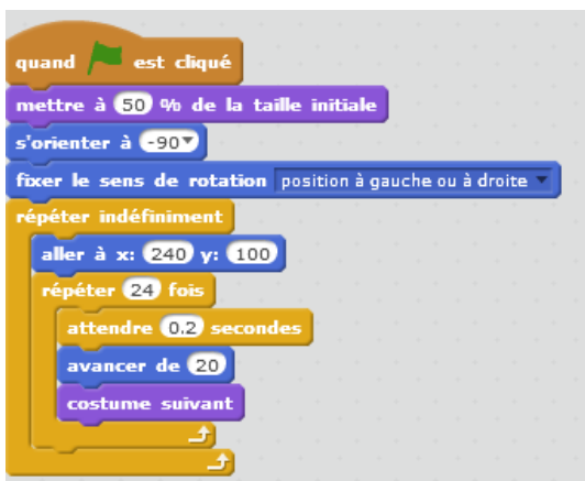
Figure 4. Exemple de codage sous Scratch

Scratch a donc été utilisé pour permettre de poser un problème avant de le coder. Ainsi, nous séparons le fond et la forme, l'idée et son codage. La démarche algorithmique reste la même, soit : « Ce que je n'explique pas clairement, je ne pourrai pas le coder simplement ». Ce qui change par rapport au passé est la forme. Avant, nous avions aussi cette démarche mais avec une feuille et un crayon. Aujourd'hui cette approche est souvent impossible.