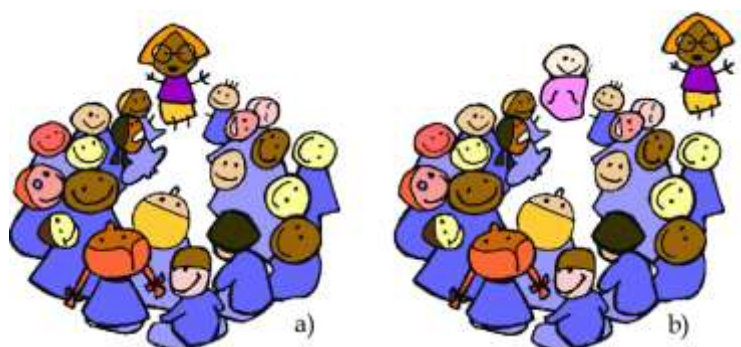
Figure 3. a/Organisation d'un apprentissage classique, b/ autre forme d'apprentissage

Nous encadrons la séance pédagogique et les étudiants nous regardaient. La charge de travail augmentant, l'idée a rapidement fait son petit chemin d'impliquer ces étudiants (Fig. 3).