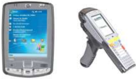
Figure 1. Solutions a/ PDA - b/ Terminal Portable