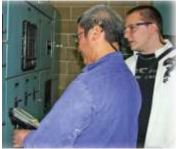
Figure 2. Solution adaptée au client final : un étudiant à l'écoute de son client

Se mettre à la portée des autres en adaptant son écoute et son discours (Fig. 2) est une compétence très importante que les étudiants doivent acquérir. Nous sommes bien placés, nous pédagogues, pour savoir que cela n'a rien d'évident. Lorsqu'ils conçoivent un produit technique, ils doivent appréhender que le produit sera perçu différemment par un ingénieur, un ouvrier, un comptable ou... un enfant.