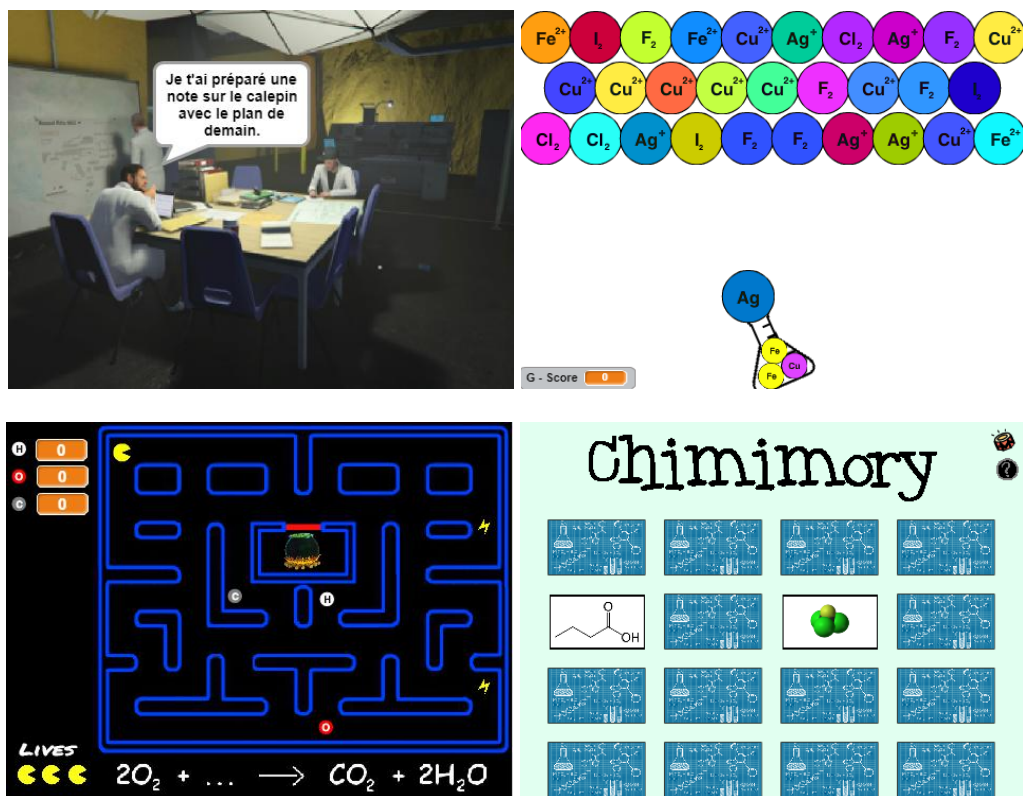
Figure 3 : Capture d'écran de quatre jeux sérieux réalisés dans le cadre de l'ARE ChemCraft

Suite à cette première partie, les étudiants travaillent ensuite sur des articles scientifiques de chimie pour choisir la problématique qu'ils traiteront dans leur jeu. La troisième partie de l'ARE est la plus importante et permet aux étudiants avec une approche par projet de réaliser un travail collaboratif afin de produire le jeu sérieux en Scratch et de le défendre devant les autres lors de la dernière séance de restitution des travaux réalisés.