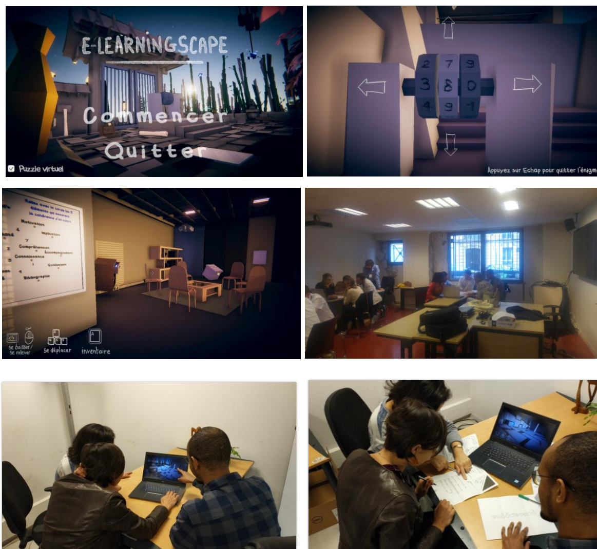
Figure 2 : Visuel du jeu E-LearningScape et exemples d'utilisation

E-LearningScape a été expérimenté à quatre reprises. La première session de jeu a été organisée lors de la formation des nouveaux enseignants-chercheurs recrutés à Sorbonne Université et les trois sessions suivantes avec les doctorants de Sorbonne Université ayant des charges d'enseignement. L'organisation des séances a suivi le format suivant : 1 heure de jeu par groupe de 4 joueurs suivi d'une session de débriefing de 30 min sur l'expérience de jeu et les concepts abordés.