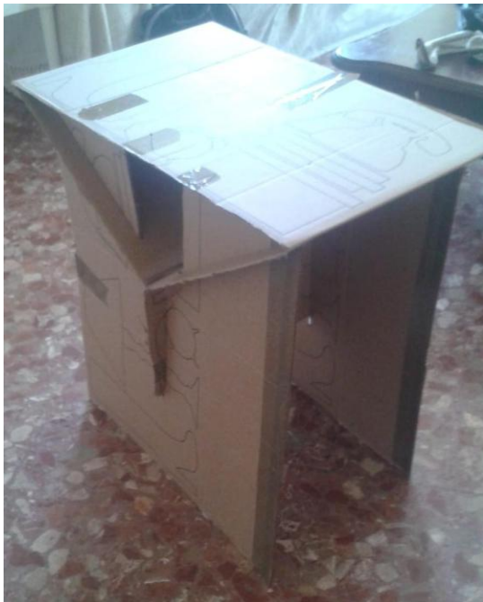
Figure 5. Table pliante en carton