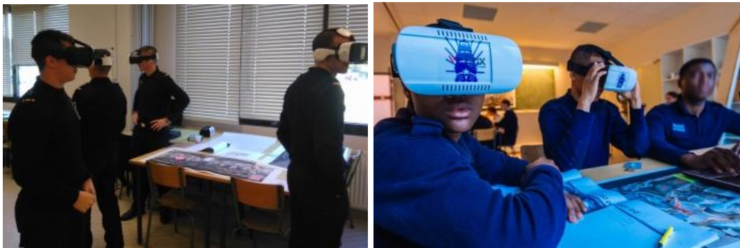
Figure 2 : Elèves-officiers avec casques de RV

Le cours en RV, d'une durée de 4 heures, débute par une présentation des objectifs de la séance, de la mise en œuvre du matériel et du scénario pédagogique. Répartis en groupes (4 à 5 personnes) les élèves, guidés par un jeu de piste, repèrent les éléments des installations et les replacent dans leur environnement (ils légendent, avec des notes adhésives, des photos 360° ; Figure 1 gauche).