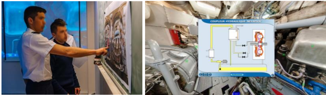
Figure 1 : Gauche : Image 360, annotée par les élèves ; Droite : contenu interactif intégré

Deux notions fondamentales sont attachées à la RV : l'immersion et l'interaction. L'immersion implique que l'utilisateur a la sensation de pouvoir « entrer dans l'image » ; le degré d'immersion dépend donc de la technologie utilisée (Slater et al., 1995). Dans le cas de notre dispositif, un degré d'immersion était souhaité, tel que capable de permettre à l'apprenant d'appréhender les dimensions et les volumes des équipements étudiés, ainsi que leur implantation relative. L'interaction implique qu'il a la possibilité d'agir sur une partie de l'environnement virtuel afin de provoquer une rétroaction (Fleury 2010), renforçant le sentiment d'agence, de contrôle, ce qui peut permettre d'améliorer l'engagement. Dans notre dispositif, il nous a paru important d'ajouter de l'interaction (certains éléments de l'environnement sont cliquables afin d'obtenir des informations plus détaillées sur un équipement donné, une animation explicative ; d'autres permettent d'accéder à un effet de zoom important sur une sous-partie d'un système ; Figure 1, droite).