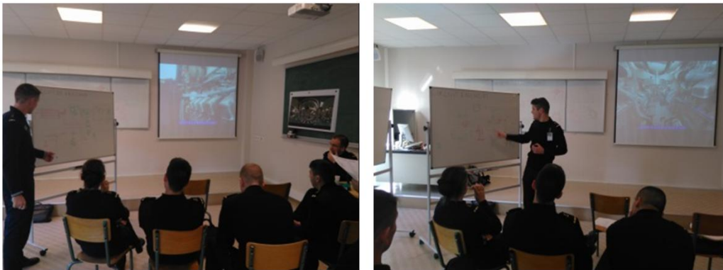
Figure 4 : Restitution et sujet technique

En parallèle du jeu de piste, chaque équipe se spécialise sur une partie du cours, qu'elle devra présenter en fin de séance à l'ensemble de la classe. Il s'agit d'une étude comparative entre les circuits étudiés en cours et les installations techniques du compartiment visité. Chaque groupe synthétise son travail à l'aide d'un tableau blanc (Figure 3), pour une restitution auprès de leurs camarades d'une durée de 10 minutes par groupe (soit 30 à 40 minutes au total). Chaque élève restitue une partie des éléments demandés lors du jeu de piste et décrit l'architecture du moteur à l'aide du tableau blanc numérique (TBN) et des visites immersives. Ils se partagent le temps de parole et présentent le sujet technique étudié (Figure 4). Ainsi, les élèves reformulent et animent une partie du cours pour leurs pairs. La séance de travail (jeu de piste + étude du sujet technique) dure environ 3 heures.