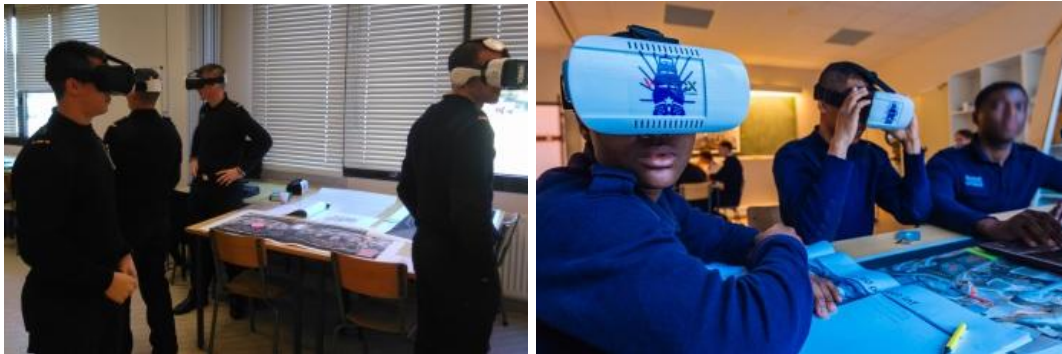
Figure 2 : Elèves-officiers avec casques de RV

Le cours en RV, d'une durée de 4 heures, débute par une présentation des objectifs de la séance, de la mise en œuvre du matériel et du scénario pédagogique. Répartis en groupes (4 à 5 personnes) les élèves, guidés par un jeu de piste, repèrent les éléments des installations et les replacent dans leur environnement (ils légendent, avec des notes adhésives, des photos 360° ; Figure 1 gauche).