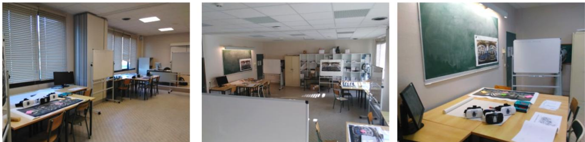
Figure 7 : L'espace d'apprentissage : une ergonomie facilitant la coopération

La forme du cours axée sur une pédagogie coopérative s'est accompagnée d'une réflexion sur les espaces d'apprentissage et le matériel pédagogique. Un espace aux tables alignées en rangées, sans mobilier spécifique ni écrans collaboratifs, permet difficilement le travail d'équipe. La réorganisation en îlots ouverts, avec écrans partagés, tournés vers le centre de la pièce, avec ajout de paperboards , de tableaux blancs pour coopérer et d'un TBN, favorise un AC de qualité. L'ensemble du volume de la classe est utilisé par les élèves pour travailler, échanger et coopérer. Les productions sont visibles par tous, à disposition de tous et incitent au débat. (Figure 7).