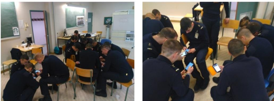
Figure 5 : Evaluation formative par équipe via un sondage en ligne

Enfin, pendant les 20 à 30 dernières minutes, une évaluation formative par équipe récapitulant les notions importantes de la séance est effectuée sous forme d'un quiz en ligne, sur smartphone, (Figure 5) avec obtention des réponses en temps réel, ce qui permet à l'enseignant de lever les derniers verrous à la compréhension du cours, à travers une rétroaction appropriée afin de corriger les notions mal comprises.