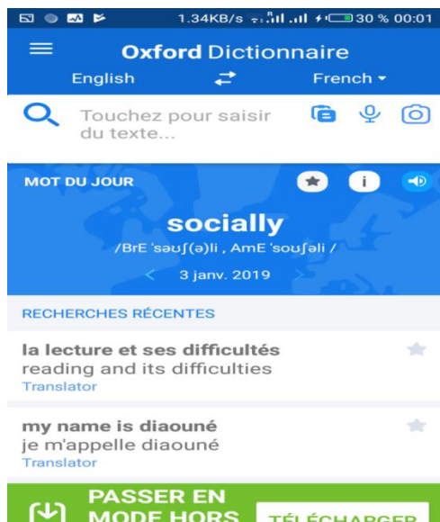
Figure 1 : Capture écran Oxford Dictionnaire