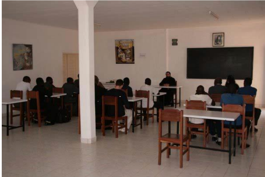
Figure 4: Séminaristes d’Afrique centrale au Séminaire de théologie « Hagios Markos » à Yaoundé. Source : Documents de l’Église Grecque Orthodoxe du Cameroun.

À travers les photographies n°3 et n°4, on ne saurait nier les changements initiés dans la formation et la responsabilisation d’un clergé local au sein de l’institution orthodoxe au Cameroun. Mais si tel est le cas, quid des foyers de concentration de cette Église dans le pays ?