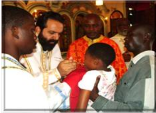
Figure 3 : Cérémonie de baptême à l'église d'Annonciation de la Vierge à Yaoundé présidé par un prêtre orthodoxe grec sous le regard des prélats camerounais.

On comprend alors mieux pourquoi depuis quelques décennies, la nouvelle mission religieuse assignée à ces hommes de Dieu est, de manière globale, de procéder à la propagation de l'orthodoxie dans les quatre coins du Cameroun et en Afrique centrale en vue de développer définitivement la foi orthodoxe auprès des populations africaines (Gregorios, 2009 : 10-15). Pour y parvenir, l'Église Grecque Orthodoxe ne fait pas/plus l'économie de la formation et du recrutement des prêtres africains et notamment camerounais depuis le milieu des années 1980. On assiste ainsi à une « camerounisation » progressive du clergé sous les bons auspices des pasteurs grecs. À preuve, sur la trentaine de prêtres que compte l'Église Orthodoxe Grecque au Cameroun en 2009, 27 sont originaires du Cameroun, ce qui témoigne de la forte présence des pasteurs locaux au sein du clergé orthodoxe dans le pays (Gregorios, 2009 : 10).