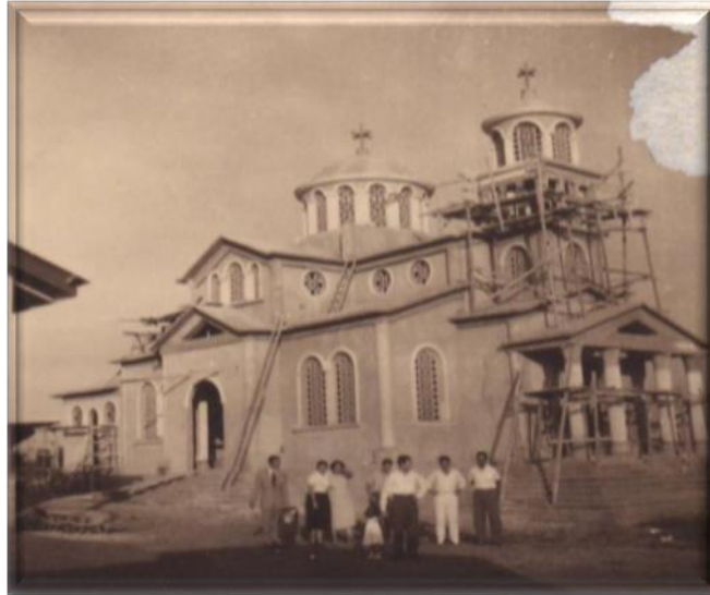
Figure 2: Travaux de construction de la cathédrale de l'Annonciation de la Mère de Dieu à Yaoundé en 1955.