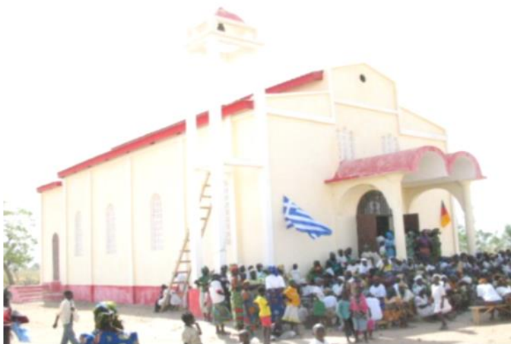
Figure 8 : Inauguration l'Église Orthodoxe Grecque à l'Extrême Nord-Cameroun, avec le flottement des drapeaux des États grec et camerounais.