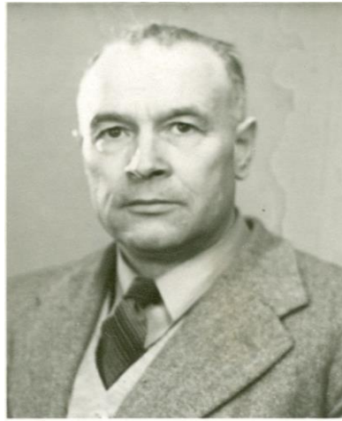
Figure 1 : Ruben Bergström, Pionnier de l'Adventisme du Septième Jour au Nord-Cameroun.

d'apprivoiser, par un déploiement des œuvres sociales (création d'un dispensaire à Dogba en 1932 puis d'une école primaire, distribution de dons divers tels que sel et vêtements), des populations non-christianisées et non-islamisées, et potentiellement hostiles à toute nouvelle croyance. Les stations missionnaires adventistes servirent ainsi de relais du message de cette Église. Selon nos enquêtes, c'est autour d'eux que se sont développées d'importantes activités telles que l'évangélisation, les soins de santé, la formation, mais aussi des œuvres caritatives.