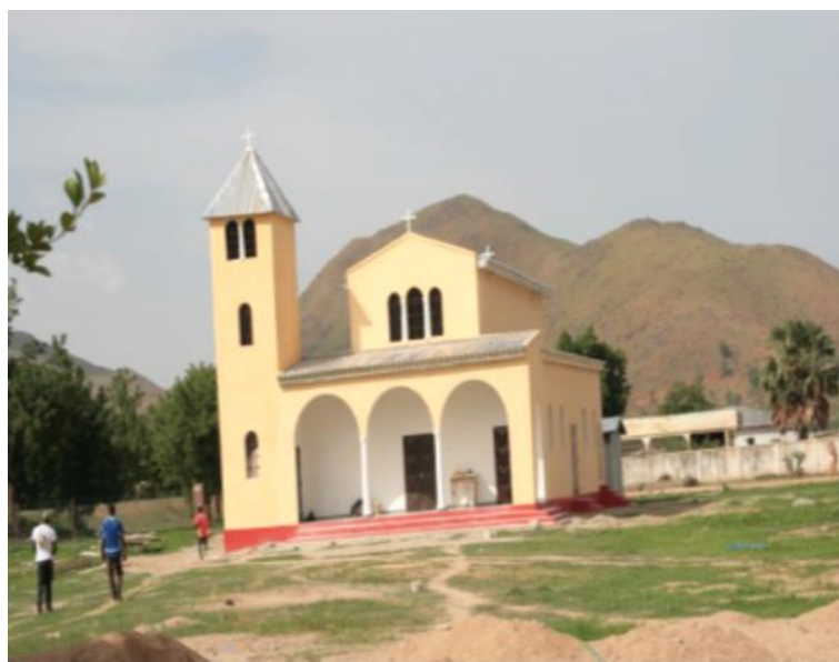
Figure 9 : La majestueuse paroisse Saint Achilios à Maroua, érigée au pied d'une colline.

À bien observer, on constate que l'Église Orthodoxe Grecque a cessé d'être seulement un lieu de culte. Sans vouloir faire de